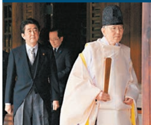
日本首相安倍晉三上月26日參拜靖國神社。

香港文匯報訊 中國外交部發言人洪磊17日在北京表示，南京大屠殺和強徵「慰安婦」是日本軍國主義在二戰期間犯下的嚴重反人道罪行，中方敦促日方尊重中國等受害國人民的感情，深刻反省歷史。