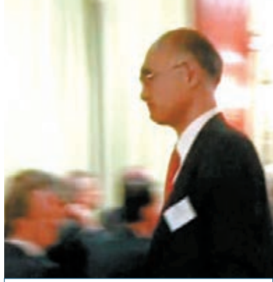
日本總領事水谷章黯然離場。

嗎？為什麼非要去做這件必須要和各國謹慎解釋的事？他並說，日中是不可搬家的鄰居，必須友好相處。