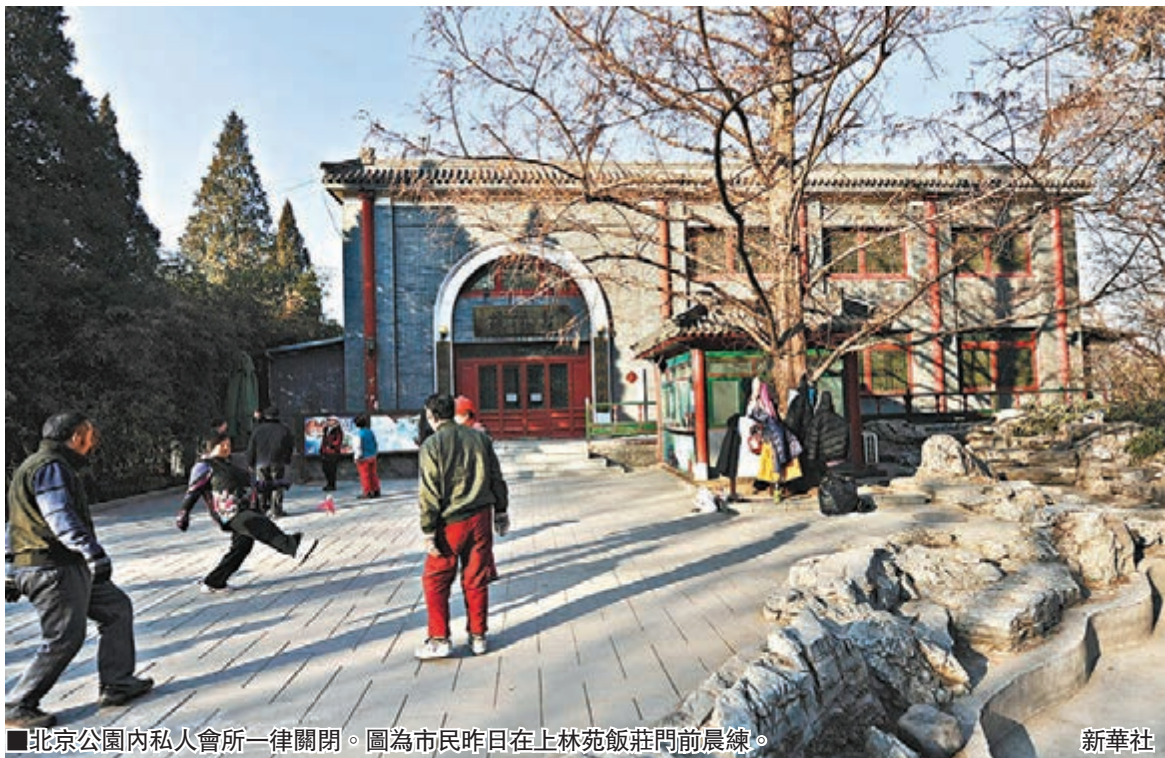
北京公園內私人會所一律關閉。圖為市民昨日在上林苑飯莊門前晨練。

汪玉凱預計，2014年中央反腐力度或將升級，轉變風氣螺絲將被擰緊。「這種風氣會對私人會所施行更進一步地擠壓。」汪玉凱同時強調，作為私人空間的會所，其存在無可厚非，應該受到法律保護。但只要其中存在公款消費現象，就應當被取締。