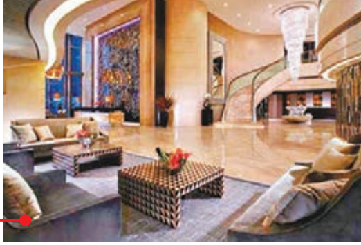
上海銀行家俱樂部裝修極盡奢華。網上圖片