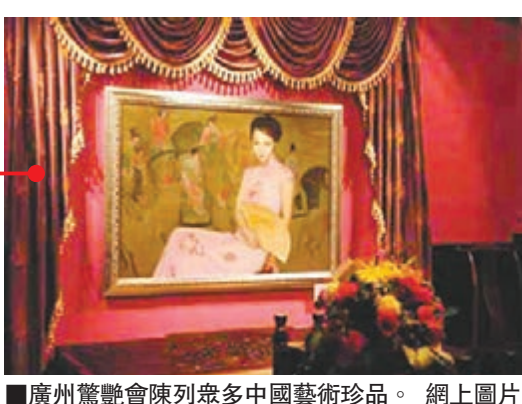
廣州驚艷會陳列眾多中國藝術珍品。