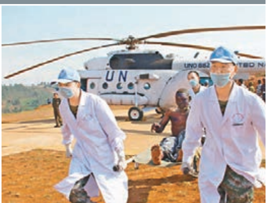
中國維和醫療分隊醫護人員在剛果(金)搬運油罐車爆炸中的受傷者。

了非洲投資環境。中國在非洲投資建立了汽車裝配、家電製造、皮革加工等生產性項目,為非洲創造了大量就業,提高了非洲國家自我發展能力。 他說,中國向非洲派出了大量農業專家,援建了很多農業示範中心和農業技術推廣站,提高了非洲國家農業生產水平,為非洲糧食安全作出了貢獻。中方在非洲修建了大量醫院、學校和體育場等設施,改善了當地百姓衛生、教育、文化生活條件。 公平價格購非洲原材料 洪磊說,中國自1963年起向非洲48國派出醫療隊員共計1.87萬人次,診治非洲患者2億多人次。中國向非洲國家提供了大量政府獎學金名額,積極開展對非人力資源培訓,提高了非洲人才素質。中國還積極參與非洲維和,現仍有1,800多名維和人員在非洲執行任務。中國是安理會五常中向非洲派遣維和人員最多的國家,為非洲和平安全作出了重要貢獻。 他說,至於中國和非洲的能源資源合作,用非