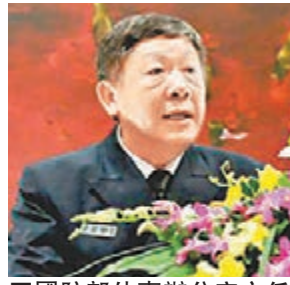
國防部外事辦公室主任關友飛。

香港文匯報訊(記者 葛沖 北京報道)據中國國防部消息,中德第15次國防部工作對話昨日在北京舉行。國防部外事辦公室主任關友飛在對話結束後介紹了有關情況。關友飛係海軍少將。對話中,中德兩軍談及安倍「拜鬼」以及反省歷史問題。 關友飛介紹,中德雙方在對話中就兩軍交流與合作、國際和地區形勢等坦誠深入交換意見,並達成多項共識。 在談及當前地區熱點時,中方表示,德國在二