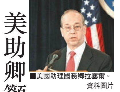
美國助理國務卿拉塞爾。