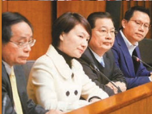
行政長官發表施政報告後，民建聯（左圖）、工聯會（中圖）及經民聯（右圖）等政黨紛紛表達看法。