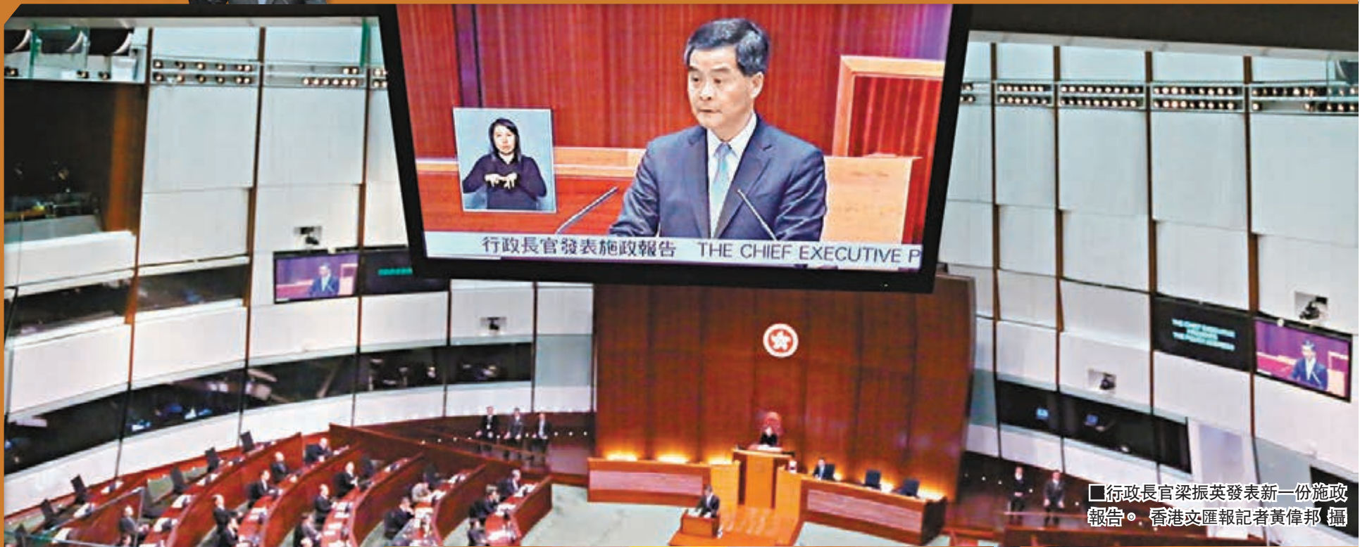
行政長官梁振英發表新一份施政報告。