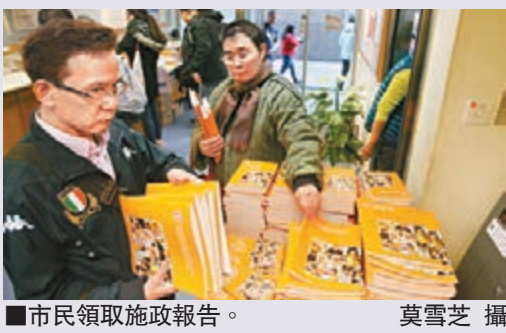
市民領取施政報告。

政府消息人士透露，特首希望透過主題向市民直接傳遞施政理念，不受字數或形式等框架局限，故以「讓有需要的得到支援」，交代出政府以較長篇幅提出大量措施扶貧、安老、助弱，包括為低收入家庭發放一筆過津貼等；「讓年青的各展所長」說明報告倡議了一系列培育下一代的政策及決心，特別是加強青年的生涯規劃，又會研究地下發展空間，最終盼望