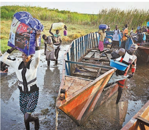
■南蘇丹內戰，難民無以為生。

軍方指該艘超載的渡輪在白尼羅河翻沉，當地傳媒則指意外可能是早在周日凌晨發生。烏干達毒彈炸叛軍據點 馬拉卡勒是油產豐富的上尼羅省首府，忠於前副總統馬沙爾的叛軍近日發動新攻勢，企圖奪取控制權。政府軍與叛軍在全國多處交戰，首都朱巴以北70公里處是最新一場戰場。叛軍宣稱成功佔領朱巴附近一個港口，但政府否認。