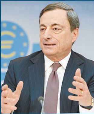
■Central Banking 網站/路透社 ■「年度行長」德拉吉

資本賬改革等，表現出強大的領導能力。德拉吉對獲獎表示與有榮焉，感謝歐元區政府厲行削減及結構性改革，但強調區內經濟復甦仍然疲弱，因此歐洲央行仍未稱得上勝利。其餘獲獎機構還包括「年度儲備管理人」哥倫比亞央行、「年度資產管理人」貝萊德等，美國聯儲局前主席沃爾克則獲頒「終身成就獎」。