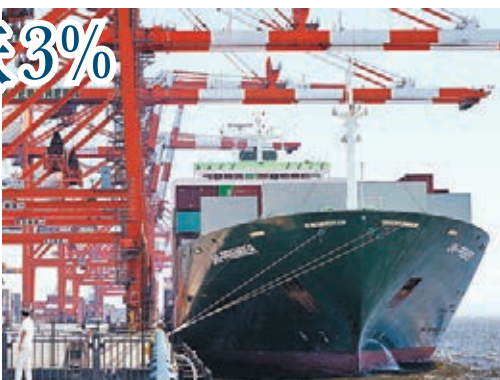
日本貿易逆差破紀錄，出口大國地位恐不保。圖為東京港口。資料圖片