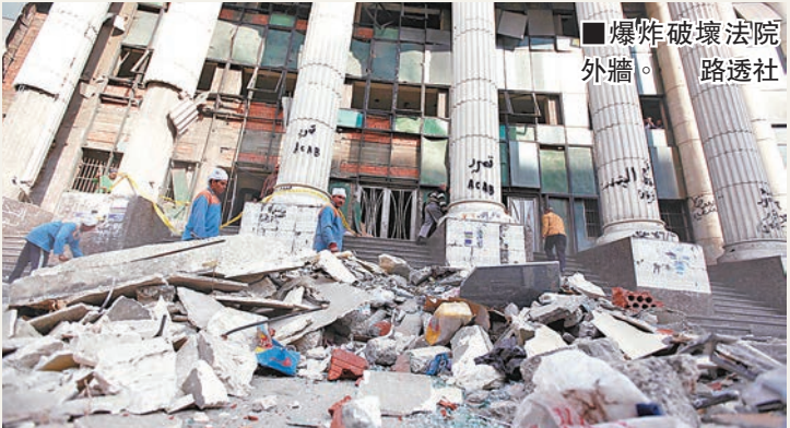
■爆炸破壞法院外牆。

埃及昨日起舉行為期兩日的憲法公投，由於新憲法是由軍政府委任的委員會起草，且內容涉及擴大軍權，軍方司令兼防長塞西視公投為民眾對其支持度的指標，若新憲法獲大比數通過，他極可能參選新一屆總統並當選。新憲法禁止任何宗教性政黨，並倡導男女權利平等、擴大言論自由及承諾保障少數派基督徒權利，但同時擴大軍方特權，如未來8年可自行選擇防長，亦有權將平民送到軍事法庭受審。支持前總統穆爾西及其所屬穆斯林兄弟會的人士，發起投反對票的行動，穆兄會等則表明杯葛公投並示威。在公投開始前約1小時，首都開羅附近吉薩省因巴拜區的北吉薩法院發生爆炸，波及外牆及數輛汽車。