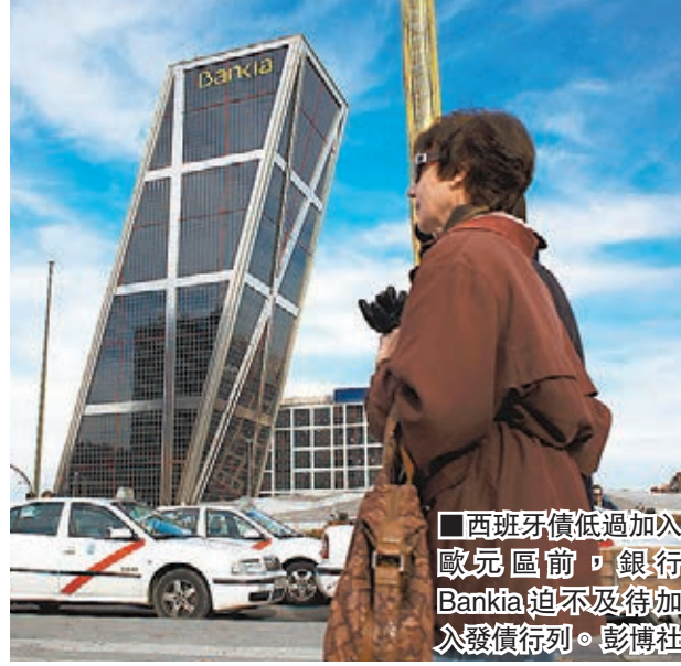
西班牙債低過加入歐元區前，銀行 Bankia 迫不及待加入發債行列。