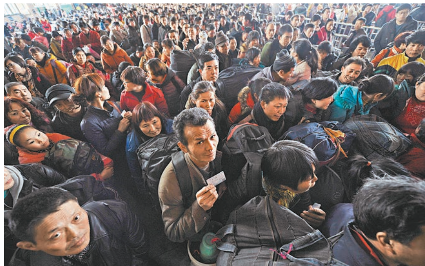
■山西太原火車站站滿大量等待檢票乘車的旅客。

香港文匯報訊（記者 馬琳 北京報道）被稱為「人類最大規模周期性遷徙」的春運即將於明(16)日拉開。國家發改委副主任連維良昨日在北京表示，今年春運期間全國客運量將達到36.23億人次，比上年增加2億人次。其中道路客運量將超過32億人次，日均8000萬人次。由於現有運力難以完全滿足春運高峰需求，一些地區仍存在「一票難求」的情況。