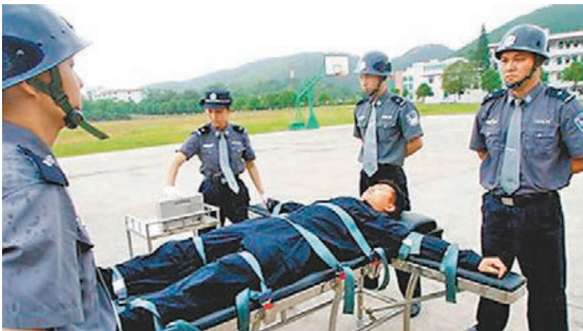
■模擬注射死刑的演練。

香港文匯報訊 據《南方都市報》報道，死刑犯的最後關頭是怎樣的呢？有媒體近日採訪廣州負責執行死刑的法警部隊，揭開死刑的神秘面紗。法警透露，不論甚麼背景的犯人，在人生的最後關頭，大都悔不當初，充滿了對生的渴望。執行死刑前，法警通常會請死刑犯抽三根「上路煙」，祝其一路走好。