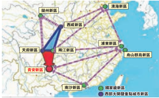
克志也寄望,新區要做到「一年有框架、兩年有效果、三年有形象、五年大發展」。

《批覆》強調,貴安新區建設要着力推進體制機制創新,探索欠發達地區城市發展建設新模式;着力調整優化經濟結構,建立現代產業體系;着力提升對內對外開放水平,促進區域經濟協調發展;着力推進生態文明建設,促進人與自然和諧發展,不斷增強綜合競爭力,帶動周邊地區共同發展,把貴安新區建設成為經濟繁榮、社會文明、環境優美的西部地區重要的經濟增長極、內陸開放型經濟新高地和生態文明示範區。