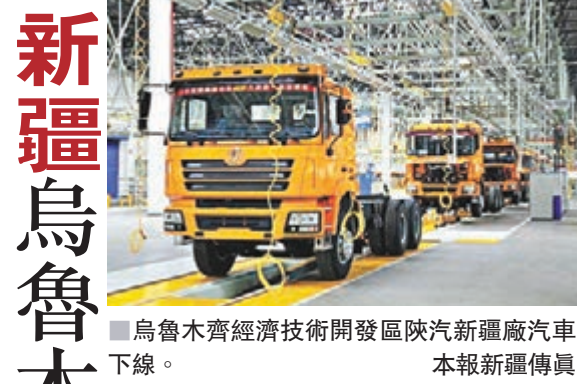
■烏魯木齊經濟技術開發區陝汽新疆廠汽車下線。

香港文匯報訊(記者 李夢莉 新疆報導) 2013年烏魯木齊經濟技術開發區(頭屯河區)工業總產值突破1000億元,成為新疆首個工業總產值過千億元的工業園區。