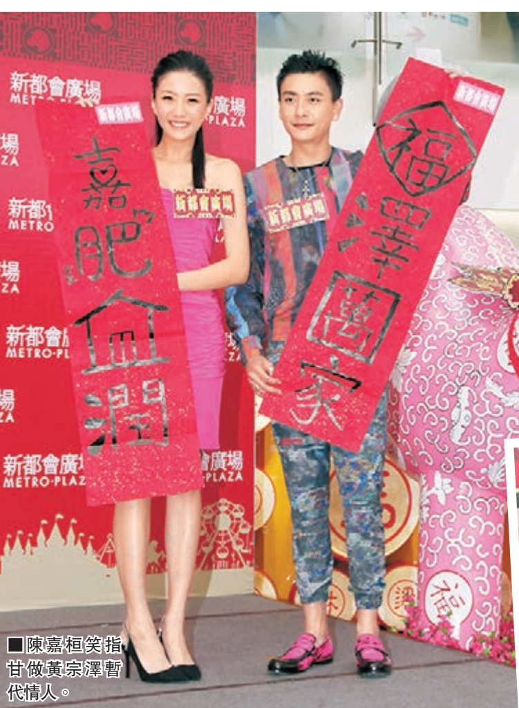
陳嘉桓笑指甘做黃宗澤暫代情人。