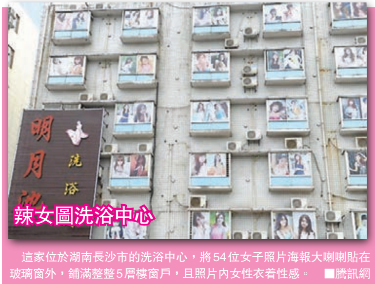
這家位於湖南長沙市的洗浴中心，將54位女子照片海報大喇喇貼在玻璃窗外，鋪滿整整5層樓窗戶，且照片內女性衣着性感。

據謝雨均的技術團隊介紹，日日的嚴寒天氣無論對車輛的性能，還是對車手的身體素質和駕駛技術來說，都是前所未有的考驗。此外，謝雨均所駕駛賽車也經過了「大手術」改動：車輛原重1.9噸，改裝後減掉0.3噸，目前重量為1.6噸；僅密封車身的複合膠就被清除了40斤，連門把手都被換成了布條，座椅、方向盤、安全帶、油門、減震器、離合踏板逐一改裝，全車沒有一個多餘零件，僅車輛的改裝就花費了100多萬元人民幣。