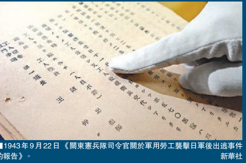
1943 年 9 月 22 日《關東憲兵隊司令官關於軍用勞工襲擊日軍後出逃事件》的報告。