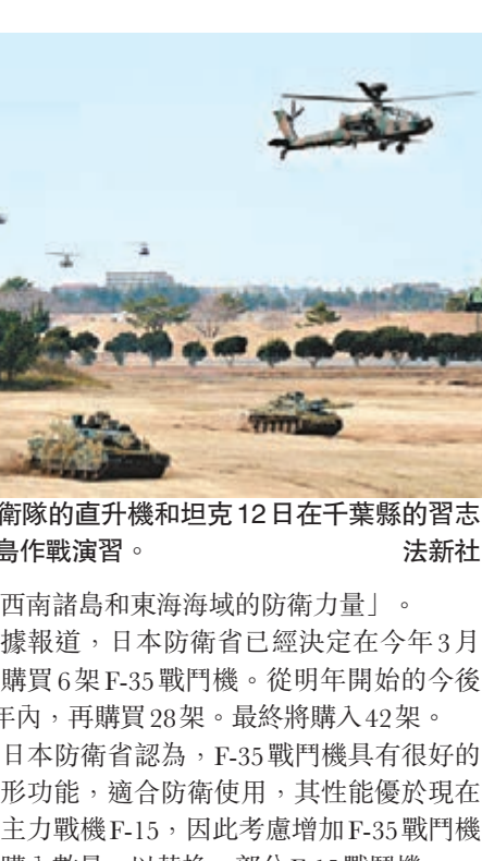
日本陸上自衛隊的直升機和坦克 12 日在千葉縣的習志野基地進行奪島作戰演習。

另據日本新聞網 12 日報道，日本防衛省計劃大幅增購 F35 戰鬥機的購入數量，以「強