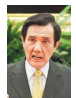
馬英九在臉書批安倍參拜靖國神社。

香港文匯報訊 針對日本首相安倍晉三參拜靖國神社，馬英九 11 日晚通過臉書(Facebook)表示，日本此舉再次為東亞區域安全種下不安定因子，「身為中華民族一分子，對日本政府這種不顧鄰國歷史傷痛的行動，難以理解，何止失望而已。」