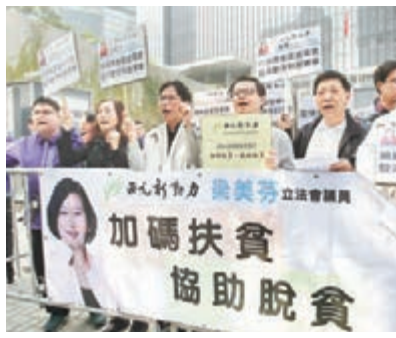
梁美芬聯同多名區議員向特首提交對施政報告的訴求。

香港文匯報(記者 聶曉輝)施政報告公布在即,西九新動力主席、立法會議員梁美芬昨率領十多名西九新動力成員,到政府總部門外請願,要求當局在施政報告內「加碼扶貧、協助脫貧」,改善市民環境生活質素。西九新動力提出7項重點建議,包括加快舊區重建與新市鎮發展,提升教育質素與學位規劃,改善海港水質及完善大廈管理與治安問題等。