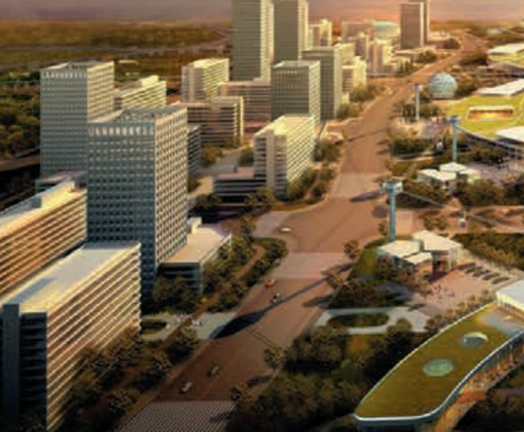
天津濱海東疆保稅港區(效果圖)。

從中央政府角度說,中國新一輪的發展,動力何在?以前是先通過一個實驗來嘗試,這就是特區。特區的成功,也可以。也可以。但今天的形勢提出了兩個全新的要求,一、(一般情況下)只能成功,不能失敗;二、在試點本身成熟的過程中就向全國推廣。