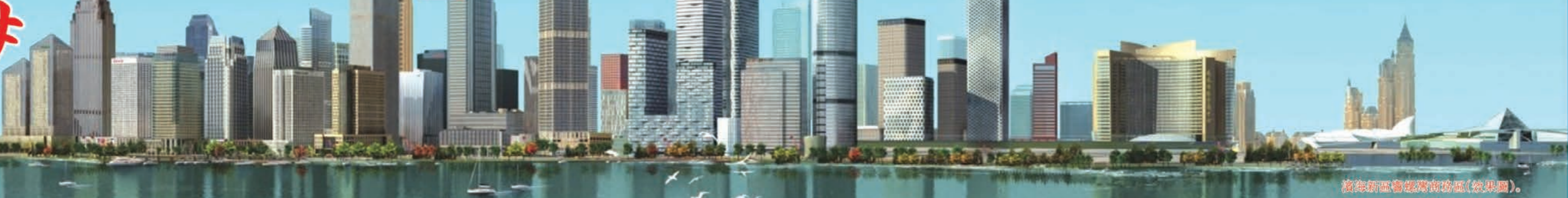
濱海新區總體規劃(效果圖)。

香港文匯報訊(記者 趙大明 李欣 天津報導)新年前夕,李克強總理考察天津時表示,天津可在濱海全區 2270 平方公里範圍內建設投資與服務貿易便利化綜合改革創新區,讓中國乃至世界的目光再一次聚焦天津。特別是李克強總理指出,天津創新區與上海自貿區相比,此區非彼區,此區政策或可優於彼區,更是令各界耳目一新。