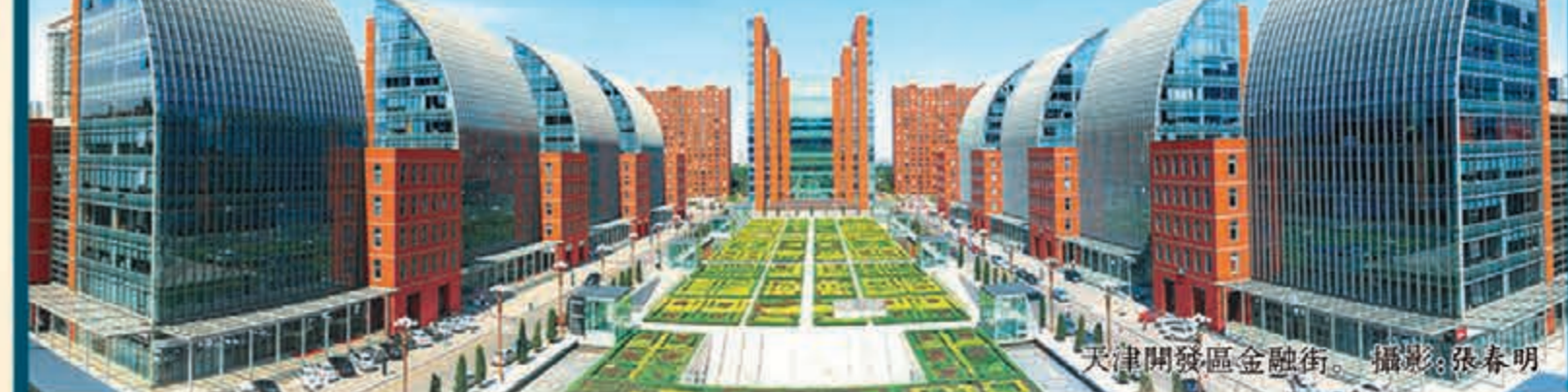
天津開發區金融街。

香港文匯報訊(記者 鄧新 天津報導)自 2006 年濱海新區納入國家發展戰略以來,國家有關部委先後批復了 10 個重要政策文件,支持鼓勵天津進行金融改革和創新,天津也為此做出了不懈的努力,奠定了廣泛的基礎,積累了可貴的經驗。