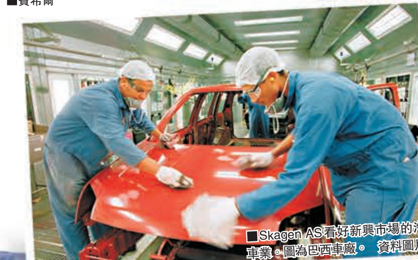
Skagen AS看好新興市場的汽車事業。圖為巴西車廠。資料圖片

費希爾是著名貨幣理論經濟學家，於2005年至去年任職以色列央行行長，他更是現任聯儲局主席伯南克的博士論文導師。 ■法新社