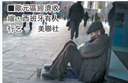
歐元區經濟收縮，西班牙有人行乞。美聯社

共和黨指里德事前沒有諮詢他們，批評他獨斷獨行，又要求在方案建議的項目以外進行削減，民主黨則批評對方不肯讓步。兩黨原定於周一表決延長失業救濟方案，假如未能在之前達成共識，方案將無法通過。 ■美聯社/《紐約每日新聞》