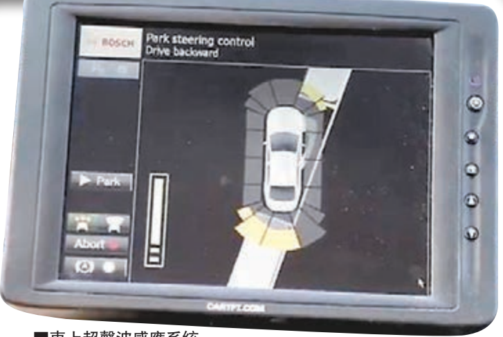
車上超聲波感應系統