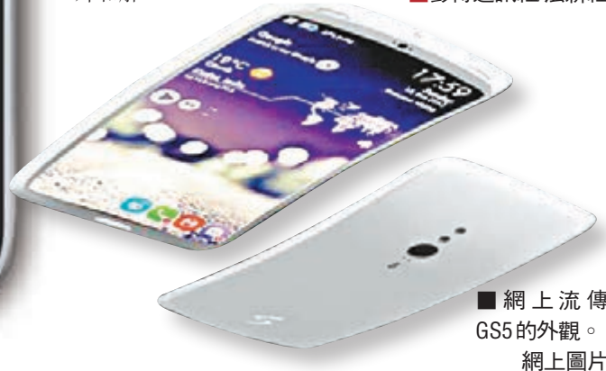
網上流傳GS5的外觀。網上圖片