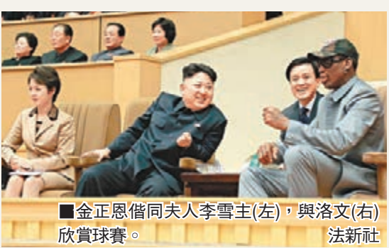
金正恩偕同夫人李雪主(左)，與洛文(右)欣賞球賽。