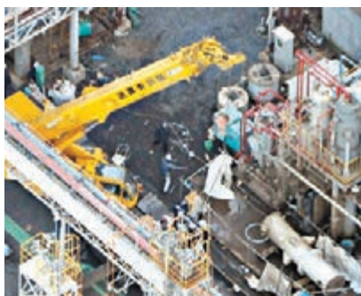
相關人員在爆炸現場善後。