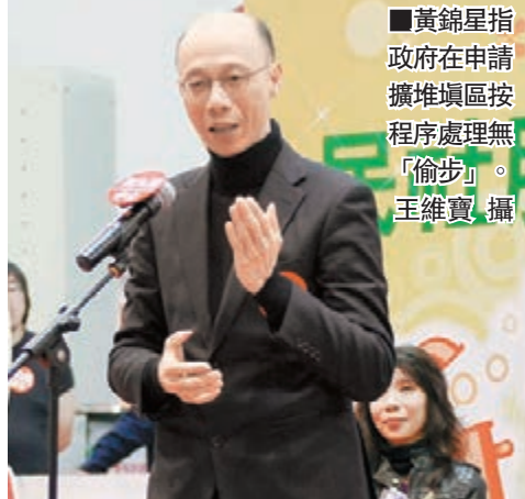
黃錦星指政府在申請擴建堆填區按程序處理無「偷步」。

黃錦星又表示，當局在去年暑假到現在已做了大量工作，包括源頭減廢、「惜食香港」運動及討論支援回收業界工作，努力回應社會訴求，希望計劃能夠得到立法會支持。