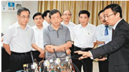
馬凱(前左二)深圳調研新能源產業時的情況。網上圖片

值得注意的是，去年初步統計，廣東依然保住內地GDP第一大省，廣東GDP超江蘇3000億，但在人均GDP上，卻比江蘇少了1萬多。 此外，經濟密度(經濟總量/區域面積)，規模以上企業數量等指標，廣東均落後江蘇，尤其在企業密度(企業數/區域面積)指標，廣東僅為江蘇二分之一。數據顯示，在人均GDP方面，早在2008年江蘇就已超過了廣東。在發展後勁上，江蘇在2011年也超過廣東。 廣東省社會科學院競爭力研究中心主任丁力表示，近年廣東經濟一哥的地位受到江蘇等省份挑戰，粵區域發展的不平衡是影響廣東後勁發展不足的主因，加上由於廣東傳統是外向型經濟，受經濟海嘯影響加大，而江蘇是內外源混經濟發展模式，受海外衝擊相對較小。他指出，要真正解決區域發展不平衡問題，通過改革與發展再造廣東區域發展模式是關鍵。