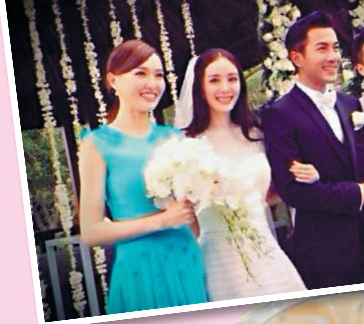
■楊冪在微博寫上:「謝謝今天的一切,謝謝所有的祝福,謝謝你們,我嫁囉。」