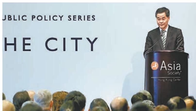
梁振英昨日在「牛津——科大領袖及公共政策系列論壇」上致辭。

展望未來，梁振英表示，十八屆三中全會決定描繪的發展藍圖，將為香港帶來巨大的機遇和挑戰，特區政府將加強培訓，希望吸引有志服務社會的人士加入。特區政府一直非常重視公務員的培訓，為了提升公務員的公共政策及領導水準，以滿足社會各界愈來愈高的期望，公務員事務局一直有為不同級別的公務員提供廣泛的培訓及發展機遇。