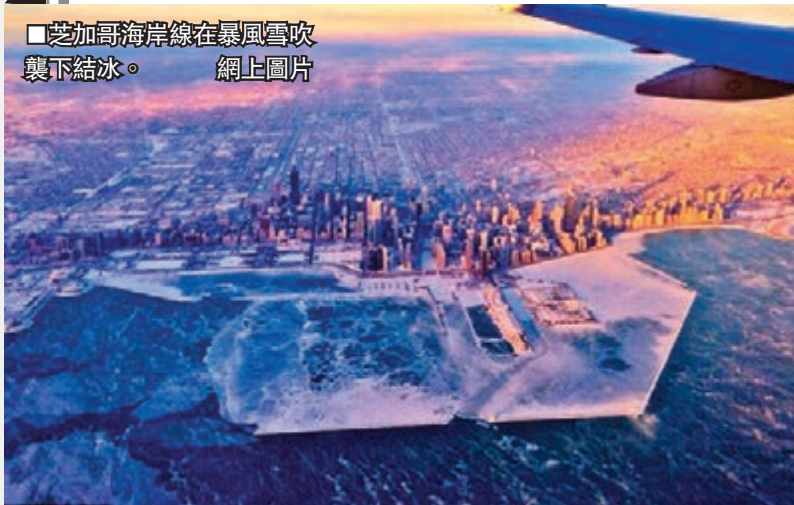
■芝加哥海岸線在暴風雪吹襲下結冰。