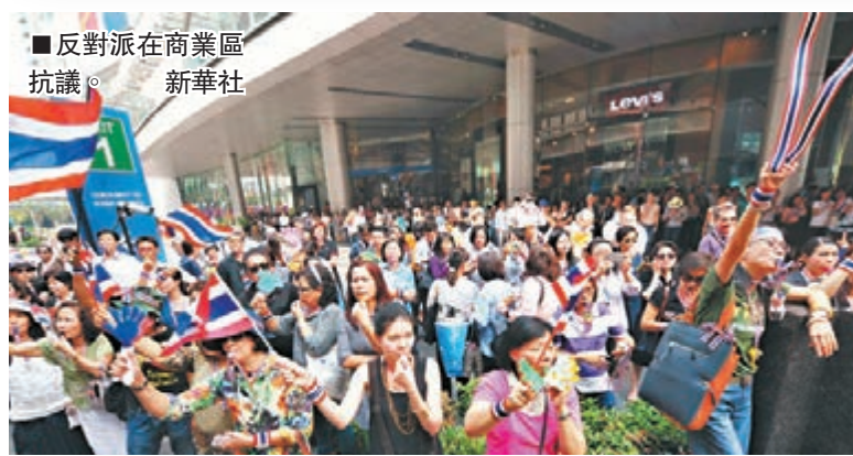
■反對派在商業區抗議。新華社