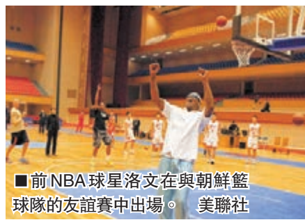
■前NBA球星洛文在與朝鮮籃球隊的友誼賽中出場。

朝鮮最高人民會議是朝鮮最高權力機構，其代議員每5年選舉一次，目前在任的第12屆代議員是2009年3月選出。此次選舉結束後，朝鮮將舉行第13屆最高人民會議第一次會議，着手推進國防委員會和內閣的改組工作。預計金正恩將再度被推舉為國防委員會第一委員長，令金正恩體制真正成形。韓國國家情報局智庫「國家安全戰略研究所」稱，選舉將讓外界得悉朝鮮的未來權力架構，張成澤派系人馬會否被取代備受注目。