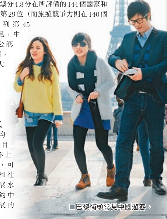
巴黎街頭常見中國遊客。