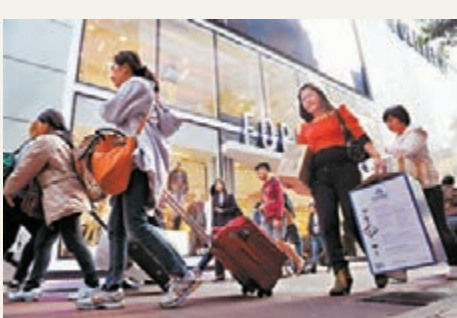
中國社會科學院預測，今年內地訪港遊客增速將放緩。

綠皮書預計，未來，香港旅遊仍有進一步的發展動力。《內地與香港關於建立更緊密經貿關係的安排》（CEPA）補充協議中提出，「加大力度支持以香港為母港的郵輪旅遊發展」，「允許內地旅行團乘坐郵輪從香港到台灣後，繼續乘坐該郵輪前往日本或韓國旅遊再返回內地。」目前，國家旅遊局已就郵輪旅遊實施發出通知，並進一步明確了具體操作細節，預計以香港為母港的郵輪旅遊將開始熱銷。