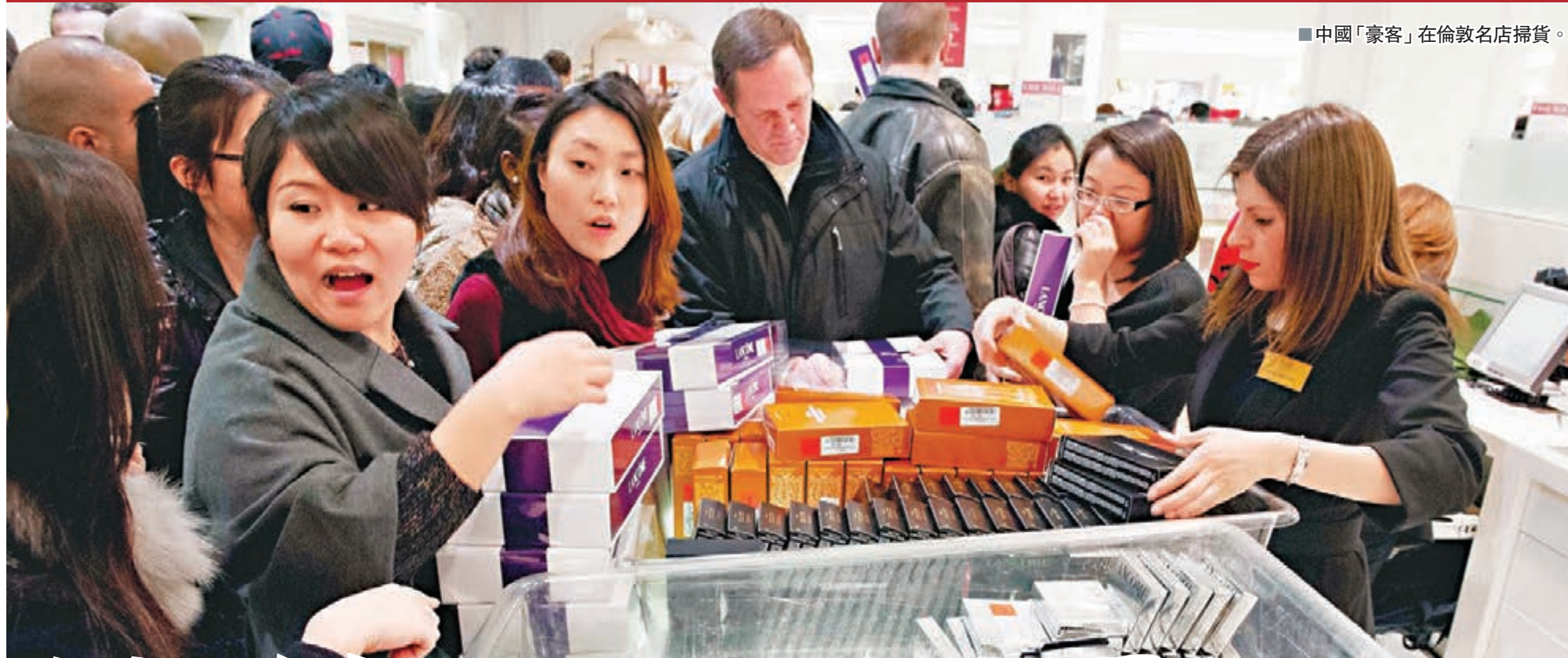
中國「豪客」在倫敦名店掃貨。