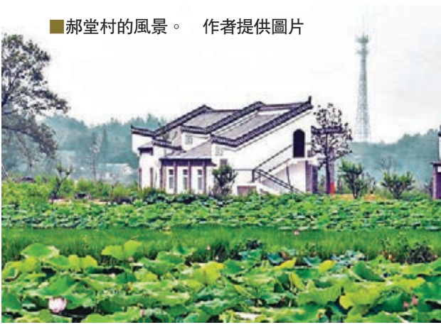
郝堂村的風景。

這些引起我極大興趣，他們的成功經驗可歸納四點：一是通過創建「社區養老資金互助合作社」探索促進村社全面發展的模式；二是建設有茶文化特