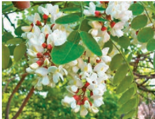
槐樹開槐花。網上圖片

老屋門前有一塊半畝多大的禾場，那是專門為打禾和堆積糧草而平整的，夏秋之季，老屋的禾場上始終一片人歡馬叫。一陣陣吱吱呀呀的軋軋聲壓過後，就見父輩們用木先揚起一串串的金黃，然後又堆起一垛垛禾草。到了冬