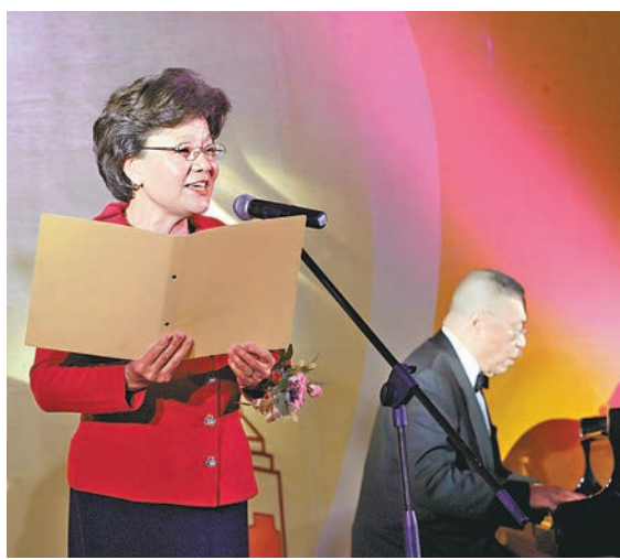
殷曉靜與劉詩昆合作表演音樂詩朗誦，為大會籌款出力。

當晚，大會更邀得殷曉靜登台，與全國政協委員、著名鋼琴大師劉詩昆合作表演音樂詩朗誦《我的祖國》，令籌款數額增加153萬元。劉詩昆與孫穎演繹鋼琴琵琶合奏，國家一級演員周旋獨唱《四季歌》、《一杯美酒》，該會女委員更盛裝表演女