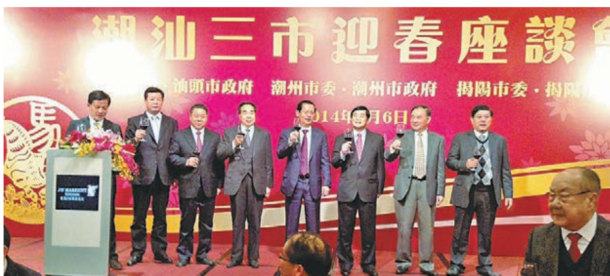
潮州、汕頭、揭陽3市聯合舉行迎春座談會，3市領導人向全場嘉賓祝酒。

迎春座談會嘉賓雲集，高朋滿座，與會主要嘉賓還有特首辦主任邱騰華，全國僑聯副主席陳有慶，中聯辦港島工作部部長吳仰偉、九龍工作部部長何靖、新界工作部部長劉林，全國政協常委戴德豐，立法會議員陳鑑林、葛蕙帆等各界人士。