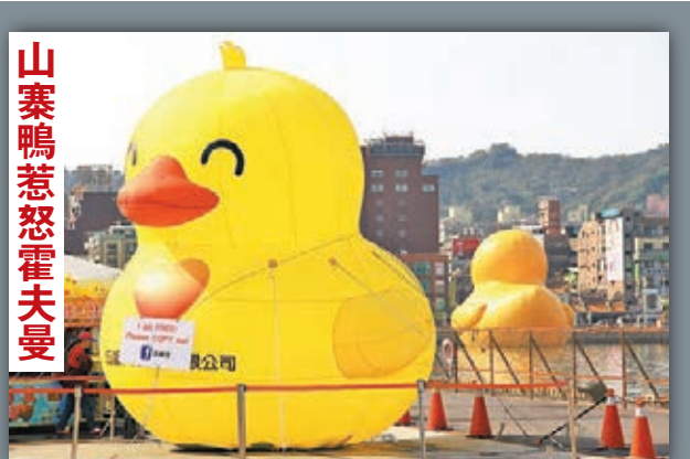
基隆黃色小鴨展覽區的攤商想打造另一巨型小鴨「夢想鴨」以吸引人潮和高機，並有意自製18公尺高巨鴨及打造新的主題夢想樂園。有關舉動引起黃色小鴨原創者霍夫曼不滿，甚至考慮提前終止基隆小鴨的展期。

至於創意的「鑑價機制」怎麼做？曾銘宗指出，「金管會」已核准並邀請台灣資產評估公司鑑價，同時核給特許執照。台灣資產評估公司也正在籌備中，專責辦理創意產業的相關鑑價。