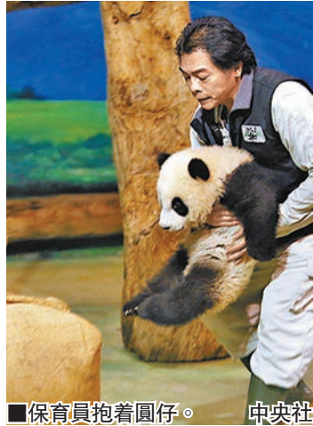
保育員抱著圓仔。中央社

香港文匯報訊 據中央社報道，熊貓寶寶「圓仔」亮相第2天，順利長大背後多虧保育員每天辛勤照顧。台北市議員許淑華昨日提出台北市立動物園保育員人手嚴重不足，市府卻不肯補人。許淑華說，動物園內有115位保育員，平均1人要照顧21隻動物，比例是美國動物園的兩倍。有3位機電室技工甚至被詢問是否願意轉任保育員。