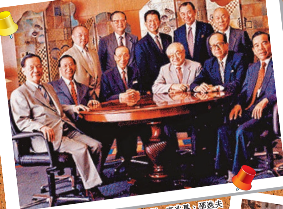
由李嘉誠、鄭裕彤、李兆基、邵逸夫共同擁有的新達城加入新加坡競逐。