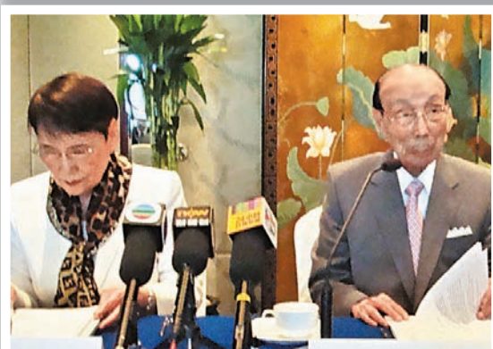
2007年9月，邵逸夫(右)仍在考慮退休之事。