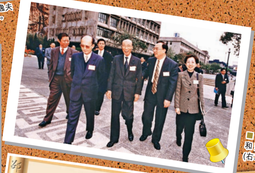
邵逸夫和張浚生(右三)。