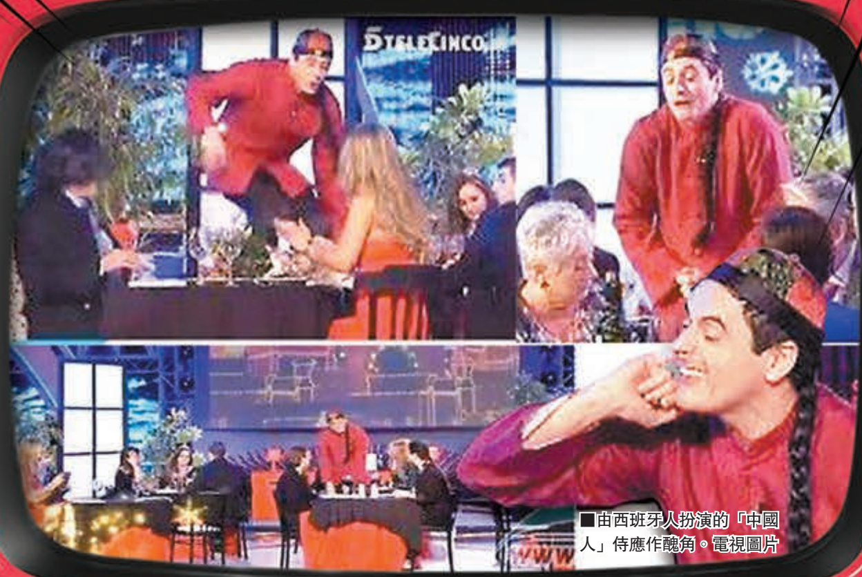
■由西班牙人扮演的「中國人」侍應作醜角。電視圖片

■穿唐裝、梳大辮子的「中國人」侍應演繹成表情古怪、痴傻、誇張且動作卑賤。電視圖片