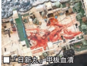
■「日新丸」甲板血漬斑斑。

日本借科研為名，多年來濫殺鯨魚，引起國際非議。美國激進環保組織「海洋守護者協會」(SS)昨發放影片及相片，可見日本捕鯨船「日新丸」號在南冰洋保護區非法獵殺4條鯨魚，血腥畫面令人震驚。SS指該船當時處於南極洲羅斯福地，是新西蘭領海及南冰洋保護區範圍，認為明顯違反國際法。