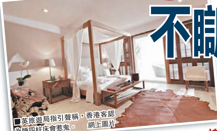
■英旅遊局指引聲稱，香港客認為睡四柱床會惹鬼。網上圖片

英國旅遊局 VisitBritain 近日向當地酒店發出旅客接待指引，以免職員冒犯外國客人。當中提到別向香港遊客提供四柱大床，因迷信的人會覺得這類床惹鬼，又奉勸職員不要對法國人微笑，卻沒有解釋原因，認真騎呢。