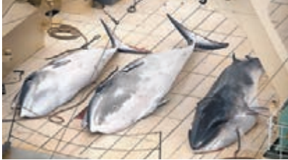
■3條小鬚鯨屍體躺在甲板上。