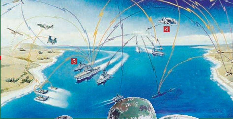
解放軍積極探索聯合作戰指揮體制。圖為濟南軍區某部在軍事演習中利用一體化作戰指揮平台調兵遣將。