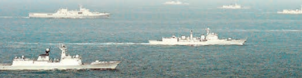
遼寧艦與水面艦艇進行協同訓練。