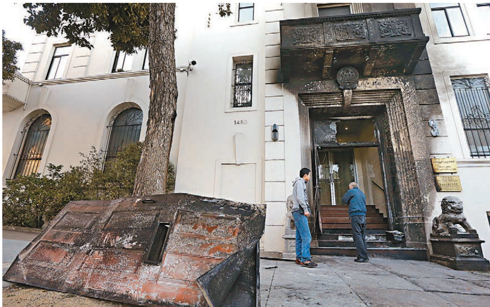
■美國國務院外交安全局昨日表示，中國駐三藩市總領館縱火疑犯已經落網。圖為總領館被縱火後的情況。

美國國務院2日發表聲明，強調對縱火案深表關切，目前美國國務院外事安全局正與美國聯邦調查局（FBI）和三藩市有關當局共同展開調查，美國國務院官員正與中方官員保持聯絡，向中方提供支持並通報最新案情。