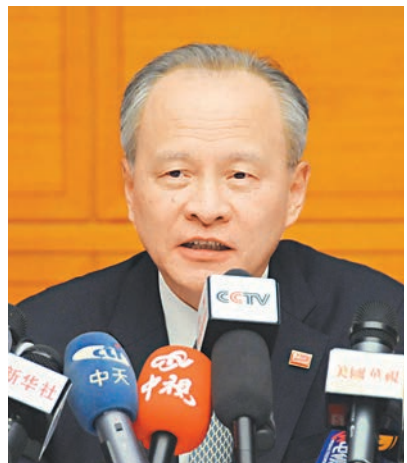
■崔天凱表示，中國駐三藩市總領館遭縱火是一宗「非常嚴重的犯罪事件」，美方已保證全力以赴予以徹查。

香港文匯報訊（記者 軼璋 北京報道）中國駐美大使崔天凱表示，中國駐三藩市總領館遭縱火是一宗「非常嚴重的犯罪事件」，美方已保證全力以赴予以徹查。崔天凱指出，中國駐美外交機構過去多次發生襲擊事件且相當一部分仍未結案，希望美方作出保證和承諾。同日，美國國務院外交安全局表示，縱火疑犯現已落網，將在當地時間6日通報詳情。此外，縱火案調查期間，當地警方已增加警力，對中國駐三藩市總領事進行24小時不間斷安全保護。