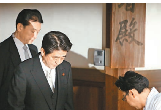
■崔天凱譴責安倍晉三參拜靖國神社是企圖重走當年日本軍國主義的道路。

對於現在頗為嚴峻的中日關係，崔天凱指出，出現這種局面責任完全在日方，特別是安倍政府，現在已經不是「安倍出來說一句什麼話就能改變這個局面」。