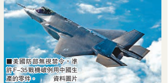
■美國防部無視禁令，准許F-35戰機破例用中國生產的零件。

香港文匯報訊 綜合報道，為了保證F-35戰機能夠順利在規定期限前投產，美國國防部竟然無視當局禁用中國製造零件的禁令，於2012、2013年數度破例准許洛克希德·馬丁公司的F-35戰鬥機使用中國生產的零件。