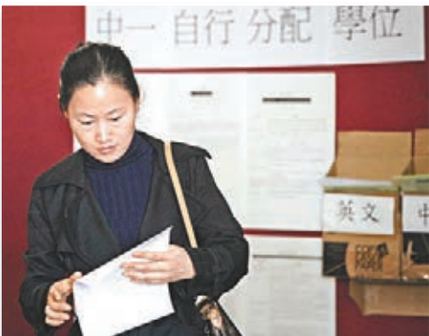
▲ 王太太斥資千萬購入太古城一單位，滿足兒子來港就學的要求。