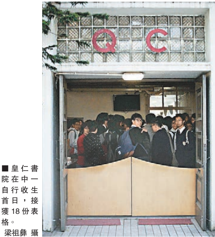
■ 皇仁書院在中一自行收生首日，接獲18份表格。

香港文匯報訊（記者 馮晉研）適齡升中學童持續減少，繼本學年大跌5,400人後，新學年將再跌2,800人，中學界正面臨收生衝擊。昨日開始接受申請的中一自行收生階段，便有多所地區名校收表數量較去年同期減少。不過，部分學校仍受家長追捧，有來自山東的家長，為讓兒子報讀儀儀名校皇仁書院，年前不惜花費千萬元置業投資移居來港；亦有皇仁書院畢業的父親，冀幼子能同入該校，月花2千元特聘外籍英語教師操練其英語，提高入學機會。