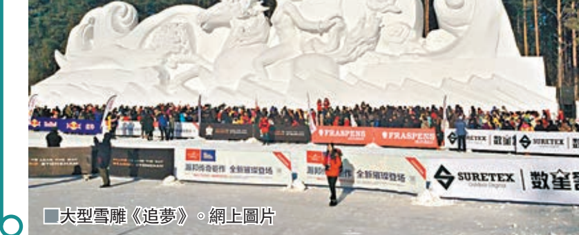
大型雪雕《追夢》。

中國長春冰雪旅遊節自1998年創辦以來,已累計接待國內外遊客9,500萬人次,實現旅遊總收入958億元。