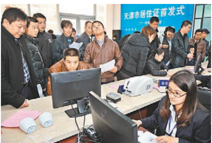
天津領居住證 天津市1月1日正式啟動外來人口居住證申領和發放工作,首批30名來津人員領到了居住證,實行多年的暫住證將不再辦理。新華社

香港文匯報訊(記者 李兵 成都報道)從成都市人民政府新聞辦傳出消息,2013年成都雙流國際機場飛機起降超25.05萬架次(日均超686架次),旅客吞吐量超3340萬人次。同時,在國際航線增加和72小時過境免簽政策的促進下,雙流機場2013年出入境旅客達到245.38萬人次,同比增長25.2%,增長率位居全國前列。截至目前,雙流機場的通航城市達到167個,航線總數達到222條,其中國際(地區)航線71條。