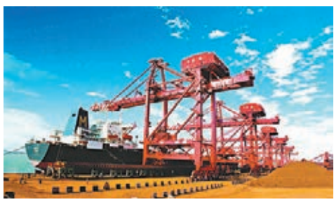
山東日照港碼頭。

為確保山東轄區海船電子簽證的順利實施,2013年12月山東海事局組織了海執執法人員、轄區航運公司等近150人培訓,挑選36條船舶進行首批試點,並加強試點船舶簽證與現場執法、船舶安檢、規費徵稽等工作協調聯動,同時成立技術保障小組,提供24小時應急服務支持。