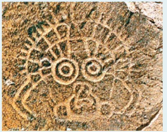
桌子山巖畫。

桌子山巖畫群位於內蒙古烏海市境內,其歷史已逾五千年,這些巖畫單獨成畫,單體圖像近千幅,巖畫群總面積達一萬六千平方米。該巖畫群類型可分為兩種,即山地緩坡巖畫、懸崖峭壁巖畫。桌子山巖畫多採用磨劃的陰紋的手法,內容以人面像居多,其人面像神態各異、精美絕倫,是區別於東西兩邊陰山巖畫和賀蘭山巖畫的顯著特徵。其豐富的文化內涵和文物價值,對研究歐亞大陸史前北方遊牧民族的審美觀念、宗教信仰等意識形態及其相關遺跡有着啓發性意義。近年內蒙古自治區及烏海市採取多項措施對巖畫進行保護。據悉,該巖畫群已於2013年7月,被國務院批准為第七批國家級文物保護單位。