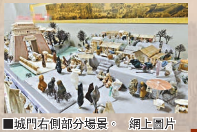
城門右側部分場景。

石，近到時下流行的瑪瑙琥珀，從羅布泊的戈壁玉，到家鄉保定的唐河彩玉，幾乎應有盡有，可以說是奇石品類的一次綜合展示。作品中應用了包括和田玉、隕石、化石等多達20個品種的天然造型。據了解，目前以《清明上河圖》為題材的奇石作品尚屬首創。其中，數十塊奇石自身價值已達數十萬，全部的近600塊奇石價值已經成為了天價，藝術價值更是無法估量。