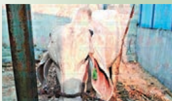
「怪牛」長了一個長長的耳朵，後背還有駝峰。