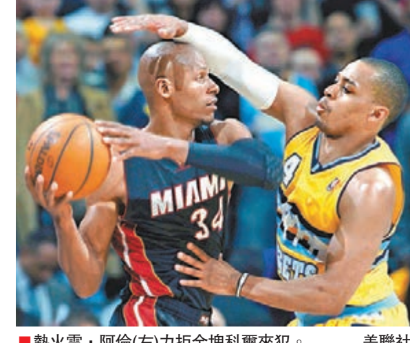
熱火雷·阿倫(左)力拒金塊科爾來犯。