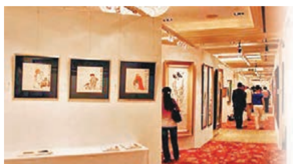
■ 嘉德進軍香港，去年秋季在港舉辦拍賣的預展現場。