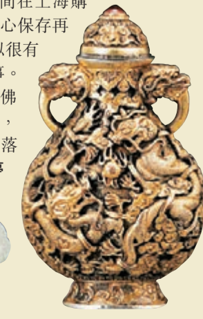
■ 乾隆款銀、銅鍍18K金龍紋鼻煙壺。