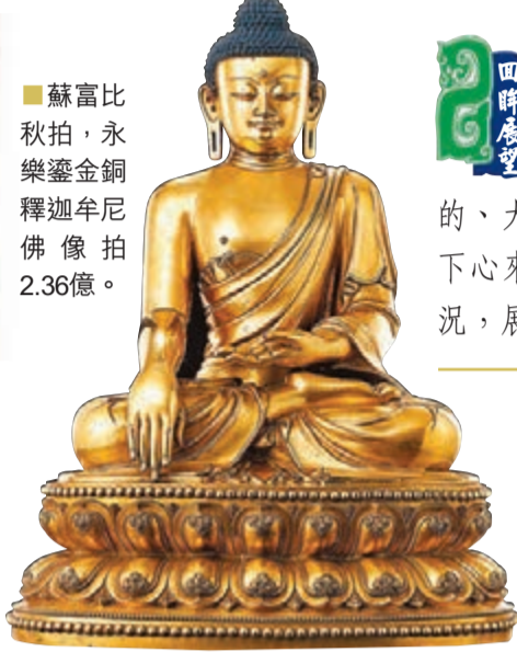
■ 蘇富比秋拍，永樂鑾金銅釋迦牟尼佛像拍2.36億。