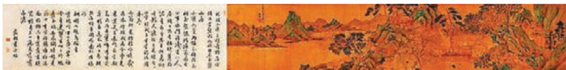
■ 東京中央春拍的文徵明《溪山深秀圖》、南宋龍泉花口盞帶葵口盞托，盞托拍得3,500萬日圓。