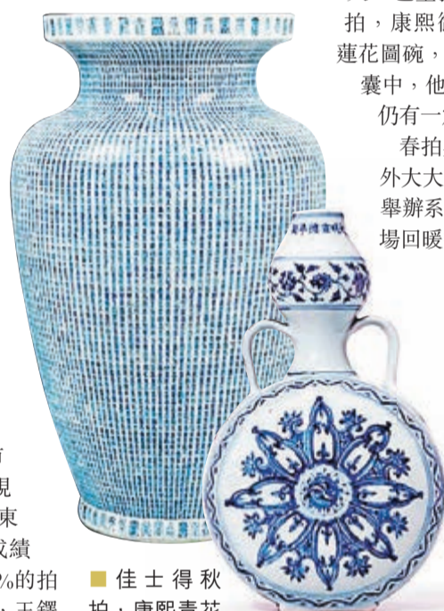
■ 佳士得秋拍，康熙青花萬壽尊5,650萬港元落槌。

紐約開了好頭，業內外均認為市場在逐步回暖，中國藝術品的表現是其中最強勁的。在東亞，日本東京中央春拍3月3日至6日開槌，成績喜人，首次推出的珠寶專場，99%的拍品順利易主；中國書畫備受青睞，王鏗《臨王羲之月半念足下帖》、文徵明《溪山深秀圖》等均拍出高價；楹聯專場成績不俗，茶道專場和帶鈎專場均受到買家追捧，不少拍品以高價拍出。東京中央秋拍同樣喜人，9月4日至7日的拍賣，最高價5.3億日圓是清朝織維城《秋英圖》，第二高價2.2億日圓的翡翠雕饕餮活環獅鈕鼎，是乾隆時期仿照古代青銅器而雕琢的翡翠玉器。唐三彩白馬、南宋龍泉花口盞帶葵口盞托，前者以1.4億日圓落槌；後者則為3500萬日圓。