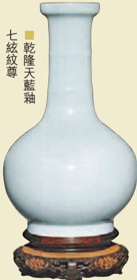
■ 乾隆天藍釉七絛紋尊

邦瀚斯今年有出眾的表現，無論在倫敦、巴黎、紐約、香港、洛杉磯、三藩市還是悉尼，其拍賣成果幾乎創下了史上的最佳成績。歲末12月17日在美國三藩市的蘇科一役「中國瓷器及工藝品」專場，可謂壓軸好戲。邦瀚斯三藩市「中國瓷器及工藝品」拍賣，共有拍品超過420件套，其中古玉是重頭，有147件，佔相當大的比例。這140多件古玉，流標的只區區6、7件，成交率頗可觀，而大部分拍出的成交價都比預期高出許多，最高者是估價的14倍。這件高出14倍估價的是長10.8cm的「麒麟送經」和田玉圓雕，麒麟口吐玉經，其角、鬃毛和尾巴雕工精細洗練，玉泛淡綠白色，在頭、背等部位保留有黃褐色的玉璞，色彩豐富又和諧。當日拍賣場上，此祥瑞象徵的「麒麟送書」大受追捧，有人舉牌才應了第一口價2萬（美元，下同），另一位即迫不及待高叫20萬。