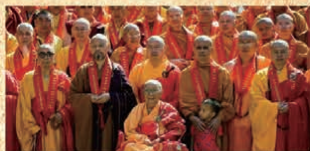
本煥長老與其弟子