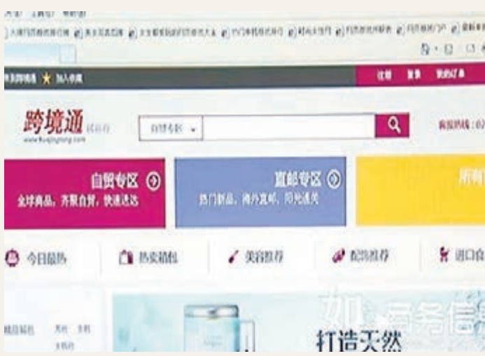
上海自貿試驗區跨境電子商務試點平台「跨境通」網站。網上圖片

據悉,跨境貿易電子商務試點平台包含了「跨境通」導購門戶網站以及報關報檢、個人行郵稅網上徵收、跨境外匯支付等系統。平台還包括位於自貿試驗區內約5000平方米的跨境貿易電子商務物流中心,規劃面積約15萬平方米。