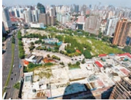
徐家匯中心項目成為上海今年拍賣土地的「地王」項目。網上圖片

同時中國指數研究院的報告也顯示,2013年1—11月內地300個城市土地出讓金總額為2.7萬億元,同比增長62.2%。中指院所統計的城市範圍為300個,而中國現有城市超過600個,按照近3年的規律,其餘300多個城市全年土地出讓收入在6000億元—7000億元之間。簡單匯總計算,今年內地土地出讓收入也有望達到3.3萬億—3.4萬億元。