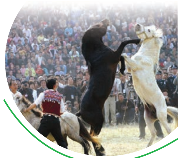
■ 廣西柳州融水苗族鬥馬表演

《標準》按照特色旅遊名縣必須具備的素質和當前旅遊發展形勢的現實要求，從特色旅遊名縣的特色旅遊景區景點建設、特色旅遊品牌打造、特色旅遊商品開發、旅遊公共服務、旅遊環境、旅遊監督管理、旅遊服務質量、旅遊教育培訓、旅遊文化娛樂、旅遊宣傳營銷、旅遊住宿設施、鄉村旅遊發展、旅遊餐飲與購物、旅遊安全與保險、旅遊產業規模、旅遊經濟發展水平等16個方面，對特色旅遊名縣應具備的素質和條件作出