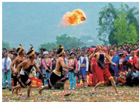
■ 廣西宜州壯族民間絕技打火球

「廣西特色旅遊名縣」的產生，按照「創建—自檢—申報—初審—驗收—命名表彰」的程式進行，在評選標準中，環境保護是評選的重要標準。獲得「廣西特色旅遊名縣」的稱號要達到總分900分，其中122分和環境保護有關，對於發展重大旅遊事件的縣區，實行一票否決。