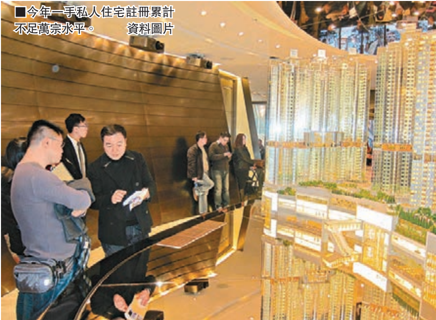
今年一手私人住宅註冊累計不足萬宗水平。資料圖片

至於註冊金額方面，同創多年低位，本年至今整體物業註冊金額暫錄約4,390.8億，料全年數字不多於4,500億元，屆時相比去年全年的6,539.6億元下跌逾3成，雖然跌幅較宗數少，不過上述數字仍然創2008年後過去5年新