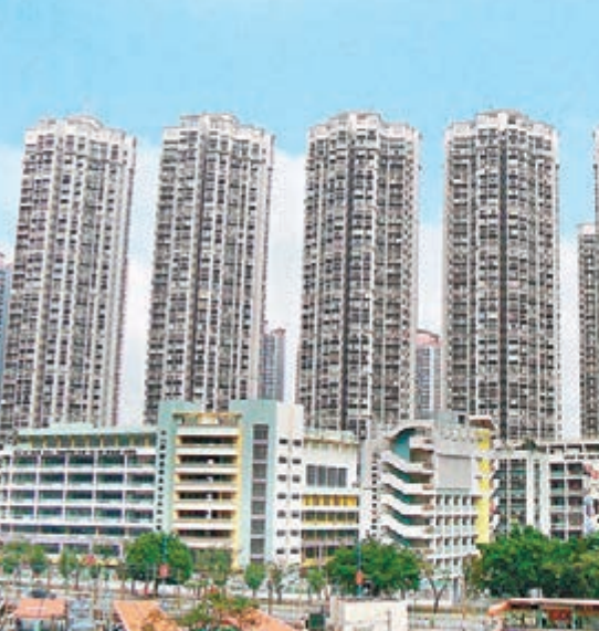
美聯統計，十大藍籌屋苑過去兩日以天水圍嘉湖山莊成交最多，買賣僅3宗。資料圖片