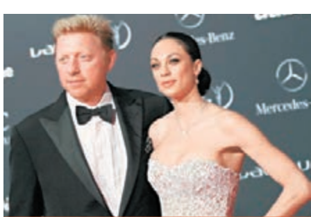
碧加本賽季任祖高域教練。圖為他與妻子。

碧加是一個絕對的天才和傳奇，身高1.90米的他利用火炮般的發球和正手拿下了6個大滿貫冠軍，同時也登頂過世界第一。碧加17歲8個月就獲得了溫網的冠軍，堪稱絕對的金童，三度問鼎溫網。