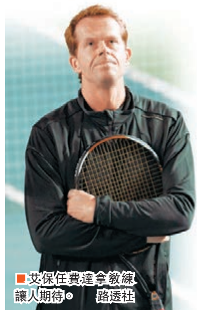
艾保任費達拿教練讓人期待。