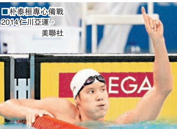
朴泰桓專心備戰2014年仁川亞運。

法國馬拉松選手涉用藥 據法國體育專業類報紙《隊報》報道，肯尼亞裔法國馬拉松運動員亞伯拉罕涉嫌使用違禁藥品EPO（促紅細胞生成素），或將面臨兩年禁賽的處罰。 根據《隊報》的報道，今年11月17日，亞伯拉罕以2小時12分28秒的成績問鼎在土耳其伊斯坦布爾舉行的第35屆跨歐亞大陸馬拉松賽後接受了尿檢。近日公佈的檢驗結果顯示，其A瓶尿液樣本中有EPO成分。 亞伯拉罕今年4月曾獲得韓國大邱馬拉松賽冠軍，並於2012年代表法國參加了倫敦奧運會馬拉松項目的比賽。