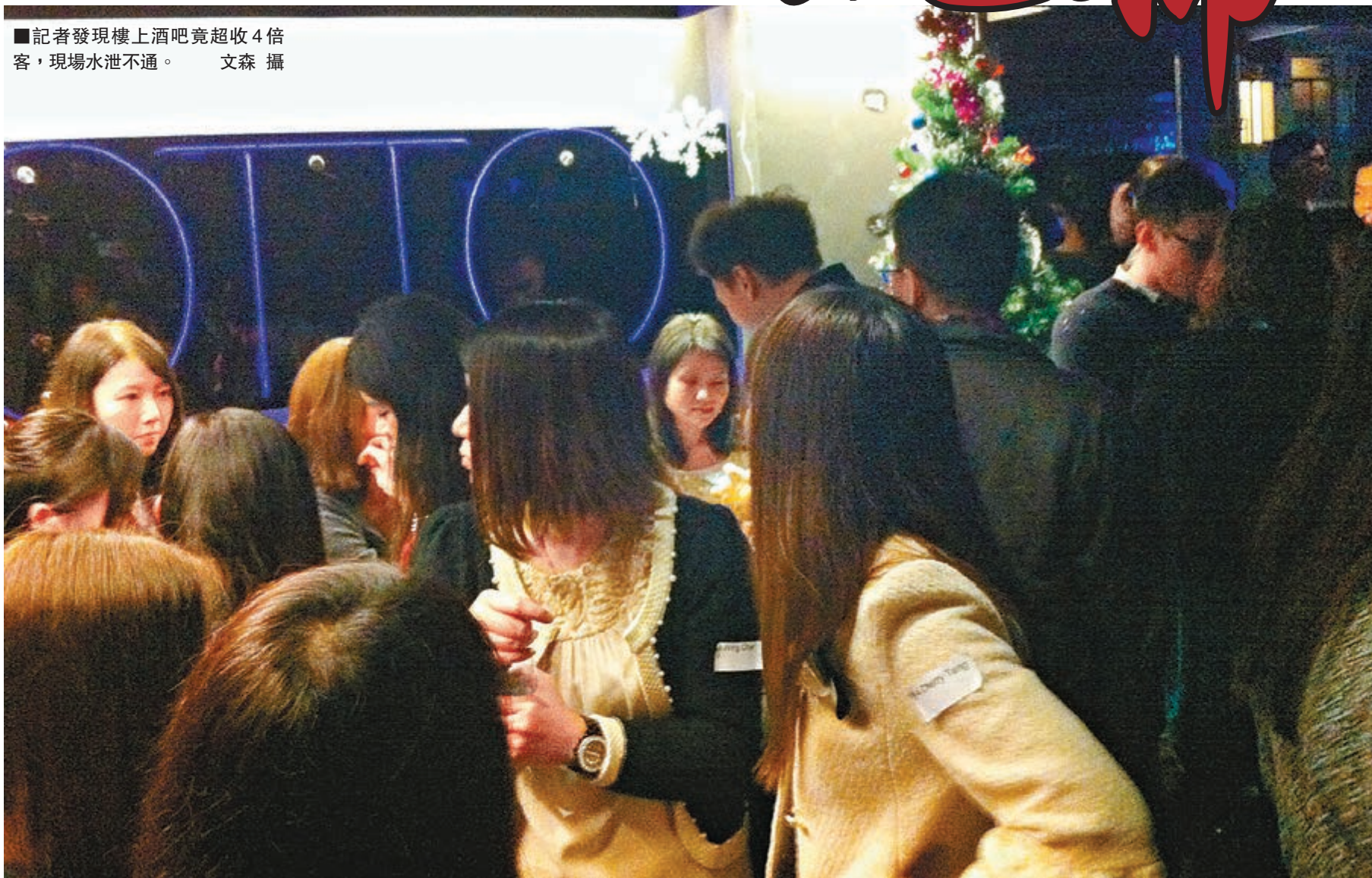
■記者發現樓上酒吧竟超收4倍客，現場水泄不通。