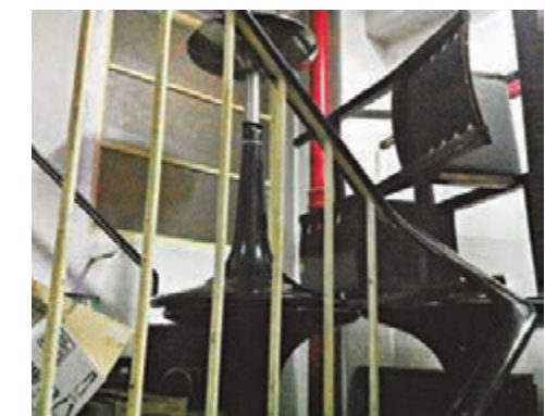
■重型酒吧椅以「疊羅漢」方式向高空發展攤開在樓梯，倒塌時恐傷途人。

節慶帶動的熱烈氣氛及強勁消費力，勢不可擋，更有不少人願意花費數千元，在樓上酒吧舉辦私人派對。本報記者日前假裝顧客致電數間樓上酒吧及親自夜訪樓上酒吧查詢，發現負責人對任何客人均來者不拒，更聲言有辦法解決人數超出上限的問題，當中心間樓上酒吧更懷疑是無牌經營。