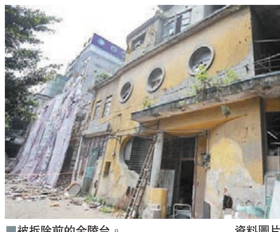
被拆除前的金陵台。