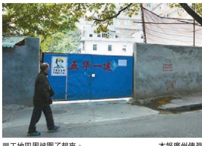
工地四周被圍了起來。