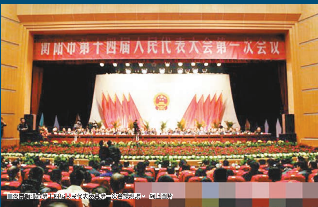
湖南衡陽市第十四屆人民代表大會第一次會議現場。

新華社長沙28日電 湖南省人大常委會27日至28日召開全體會議，對在衡陽市十四屆人大一次會議期間，以賄賂手段當選的56名省人大代表，依法確認當選無效並予以公告。衡陽市有關縣(市、區)人大常委會28日分別召開會議，決定接受512名收受錢物的衡陽市人大代表辭職。