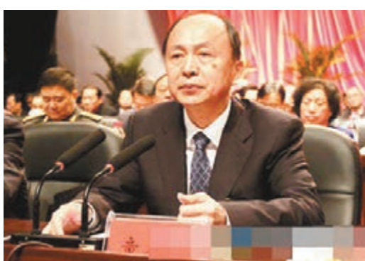
湖南省政協副主席童名謙已被免去職務。

陽市委書記、市人大換屆領導小組組長)失職瀆職，對本案負有直接領導責任，中央已決定免去其領導職務，現正在按程序辦理，由中央紀委立案調查。