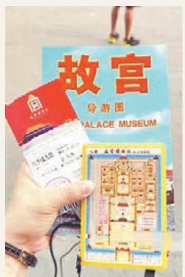
故宮正研究改革門票，圖為現有的門票及導遊圖。

單院長還透露，隨著故宮外西路開放，御膳房將變成明清傢俱館。故宮博物院還計劃將東華門改建成古建築館。同時故宮計劃開放東華門城樓一段城牆，這樣觀察大約可以參觀紫禁城城牆約六分之一。目前故宮初步設想在2015年能夠實現。