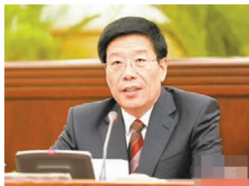
湖南省委書記、省人大常委會主任徐守盛。