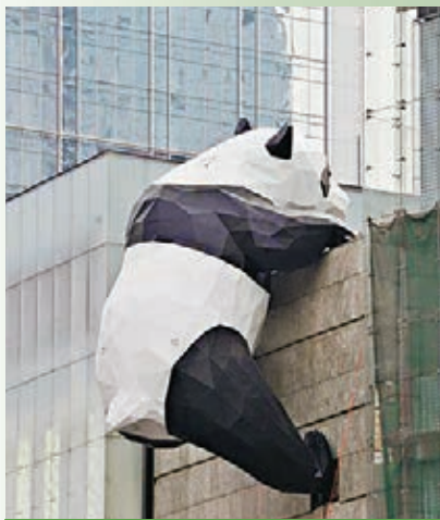
成都巨型「大熊貓」爬上金融中心外牆。

在成都春熙路商圈紅星路，一隻高約15米，由近四千塊三角形構件組成的巨型「大熊貓」爬上了國際金融中心的外牆，像是在好奇地「窺探」樓裡的世界，形態十分逼真。據了解，它是成都最高最大的熊貓裝置藝術作品，也是曾經打造《SEEWHAT YOU MEAN》及《LEAP》等被廣為人知的藝術裝置的著名藝術家Lawrence Argent(勞倫斯)在中國的首個大型戶外藝術裝置作品。