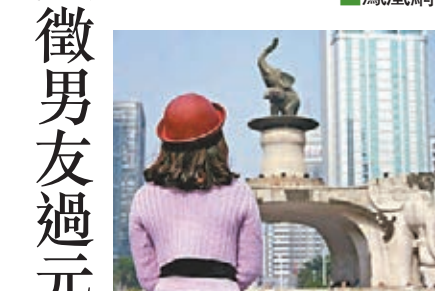
大四女生發佈自己背影與南寧各大地標的合影。

日前廣西某高校一大四女生「朋克公主」，在微博上發佈了一組自己的背影與南寧各大地標的合影。她在微博上說，希望在2013年至2014年的跨年之際，單身的她能夠找到一個男朋友，陪她「從13走到14」。「她會為誰轉身？」成為網友們紛紛猜測的話題。