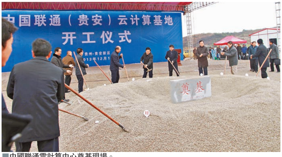
中國聯通雲計算中心奠基現場。

心項目也選址在貴安新區電子信息產業園大數據核心區，項目計劃總投資20億元，用地約275畝。項目總規模約21萬平方米，包括16萬平方米新型綠色數據中心機房，1萬平方米倉儲用房，4萬平方米生產支持用房，項目為中國移動建設的高標準、高規格、高品質的有核心競爭力的數據中心。項目將借助貴安新區區位優勢，建成國內領先的綠色數據中心示範區，成為國內數據中心的標杆。