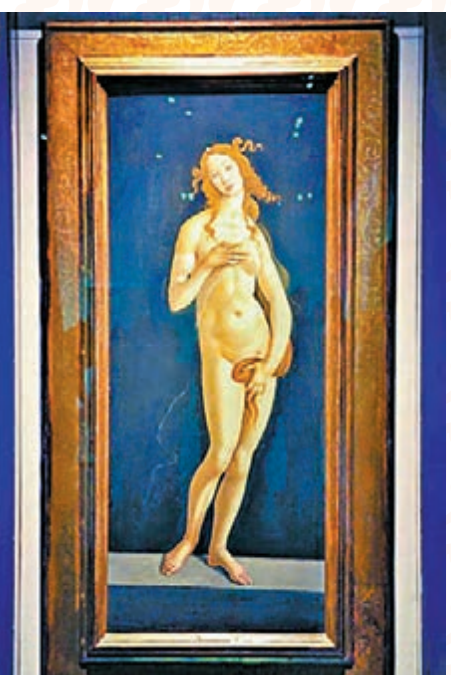
■波提切利作《維納斯》

波提切利畫中的維納斯不但成為文藝復興時代的代表人物，其作為美和不朽愛情的象徵更是延續至今。 文：張夢薇