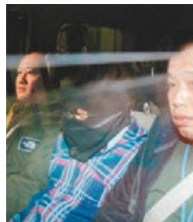
■男毒販被探員用車載返返港的女毒販年僅21歲。警察總部調查。