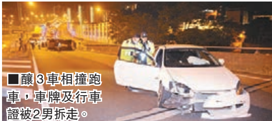
■讓3車相撞跑車,車牌及行車證被2男拆走。

香港文匯報訊(記者 杜法祖)一輛本田跑車凌晨沿青沙公路高速左穿右插變車,切線時引起另2輛車相撞,其中一輛「寶馬」四驅車更失事翻側。事發後肇事本田跑車上2名男子匆匆落車,將車牌和行車證拆走,登上另一輛由友人駕駛的私家車逃去,車禍中2名被殃及的私家車男女司機同受輕傷。警方事後將肇事本田跑車拖走,正聯絡該車車主助查尋找在逃司機下落,並調查意外是否因非法賽車引起。