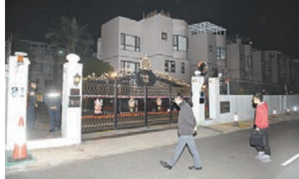
■九肚山蔚麗山莊有豪宅遭爆竊,警方到場調查。

香港文匯報訊(記者 杜法祖)爆竊集團乘聖誕節多市民外遊四出作案。港島薄扶林及沙田九肚山2幢獨立屋豪宅,在平安夜先後遭爆竊,其中薄扶林碧荔道一獨立屋,戶主聖誕舉家外遊,備工昨晨外出後返家發現遭爆竊,損失財物逾100萬元;而九肚山馬鈴徑一幢豪宅,戶主昨凌晨返家發現後門遭撬毀,失去一批首飾及手錶總值30萬元。