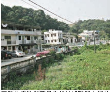
■發生唐狗與警員先後被捕獸器夾腳的大埔連澳鄉屋村。

56歲姓溫女狗主稱,原以為「咪咪」只是誤墮水坑被困,豈料牠原來被捕獸器夾傷不斷流血;又指以往數十年都未見過捕獸器「恨不得殺死放置捕獸器那個人」。捕獸器近年除危害貓狗外,也成為行