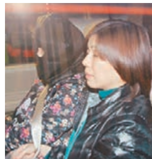
■與同居男友藉外遊運毒毒品

蔣家駿表示,該批懷疑可卡因毒品分成4袋,分別藏在4個背包內。警方約1個月前亦破獲一宗與今次路線相同及收斂方法相似的販毒案件,不排除是涉及同一犯罪集團,日後亦有機會拘捕集團主腦。由於臨近節日,估計毒品是準備供應本地市場。蔣呼籲市民勿因一時貪念犯案,販運危險藥物是嚴重罪行,最高可被判終身監禁及罰款500萬元。