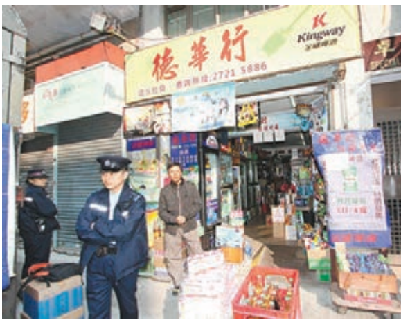
■官涌街一士多被歹徒行使假「大牛」意圖行騙,警員到場調查。

香港文匯報訊(記者 杜法祖)偽鈔集團乘聖誕新年消費高峰期「散貨」,港澳警方日前共檢獲68張2003年版中國銀行千元面額假「金牛」後,已有商戶拒收「金牛」,部分銀行的自助存鈔機亦已停收。金管局表示支付方法由交易買賣雙方決定,商戶是否接受某種紙幣,屬商戶商業決定,同時又呼籲市民小心留意2003年版,正、背兩面的圖像為中銀大廈和香港會議展覽中心的中銀香港千元鈔票。另外,2名南亞漢昨午用一張假500元「大牛」,到油麻地一間辦館購物時被機警店東識破,匆匆棄下偽鈔逃去。警方發現該張偽鈔紙質平滑製作粗劣,初步不排除是以影印機印製,列作「行使偽製紙幣」案,正追緝2名涉案南亞漢歸案。