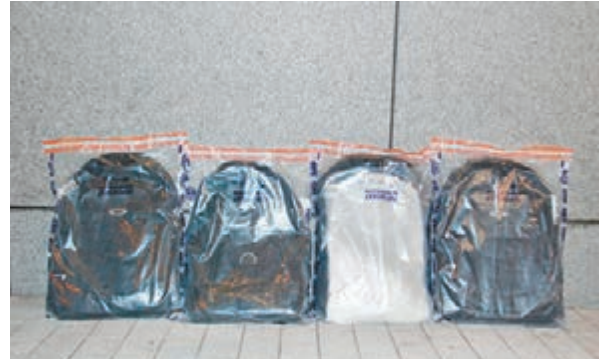
■4個背囊共有12.8公斤市值1,250萬元懷疑可卡因毒品。

事發昨午2時許,2名南亞裔男子到上址辦館購物,聲稱欲買一支價值200元的紅酒,並向東主遞上一張匯豐銀行發行的500元面額鈔票。由於昨日剛有新版千元偽鈔湧現的新聞,東主一見大額鈔票已提高警覺,接過鈔票細心觸摸後發覺有異,鈔面亦沒有「變色開窗安全金屬線」,覺得可疑,遂向2名南亞漢查問:「你是否用這張鈔票?」2人知事敗不敢回應,東主再追