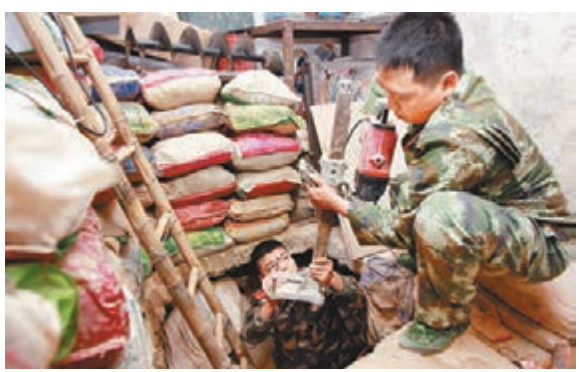
■通道內有照明設施及用於運送走私貨物的小車、軌道、繩索、滑輪一應俱全。

庫內用啤酒箱、泥土等壘成牆遮掩。另外一頭隱藏在距離路面約兩米高的港方界河河堤上,河堤接近3米高的蘆葦叢遮擋。