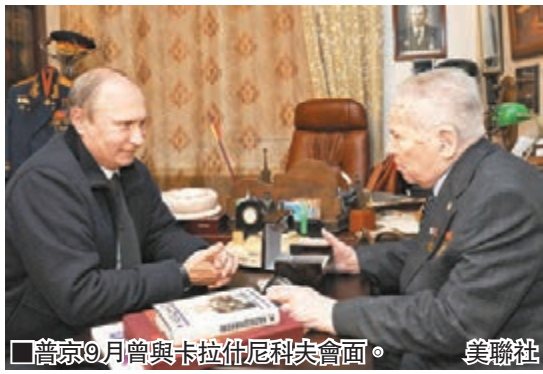
■普京9月曾與卡拉什尼科夫會面。

被譽為「世界槍王」的AK-47步槍設計者、俄羅斯武器專家卡拉什尼科夫，前日在家鄉烏德穆爾特共和國伊熱夫斯克市離世，享年94歲。俄羅斯總統普京向卡拉什尼科夫親屬致以深切慰問，讚揚他是優秀的武器設計師。AK-47是全球應用範圍最廣的槍械，估計累計產量逾一億支，目前仍有不少國家的軍隊使用這款步槍，據報它亦是全球殺人最多的武器。