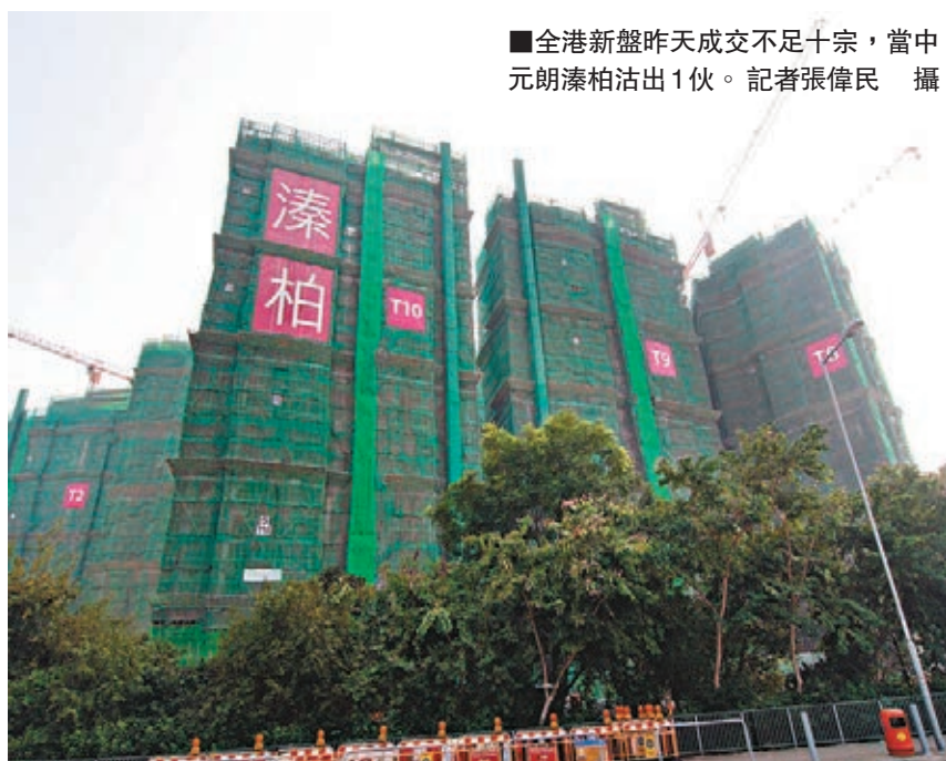
全港新盤昨天成交不足十宗，當中元朗濠柏沽出1伙。

根據逸瓏網頁顯示，此8伙特色單位即日起至本周五下午接受認購登記，於本周六上午9時半到尖沙咀中心地庫樓處報到，10時45分抽籤決定揀樓次序。倘登記人於購樓意向登記中表示意