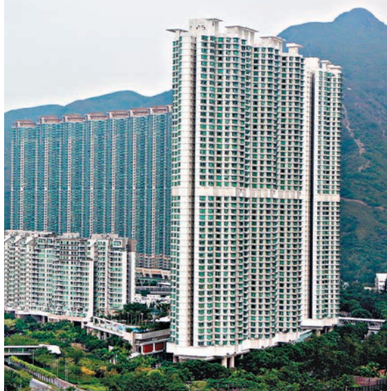
有內地用家購入東涌海堤灣畔2座高層F室。資料圖片

其他減價個案方面，中原地產指出，青衣瀨源灣9座高層A室，實用面積778方呎，業主原本叫價940萬元，最終累減46.2萬元至893.8萬元沽出單位，呎價11,488元；北角康澤花園D座低層6室，實用面積532方呎，兩房間隔，原業主於最初開價680萬元，及後見港島區一手盤主導市場，遂調低叫價至650萬元沽出，折合呎價12,218元，低市價5%。