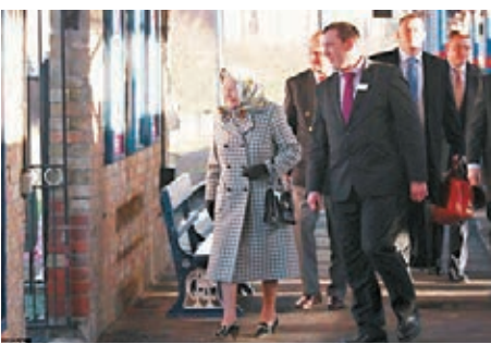
■英女王坐火車前往桑德靈厄姆宮。

桑德靈厄姆宮佔地600英畝，但面積以王室標準計屬於細小。媒體估計，女王外甥林利一家等多名成員可能要睡工人房。 ■《每日郵報》