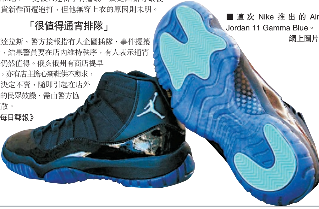
■這次Nike推出的Air Jordan 11 Gamma Blue。