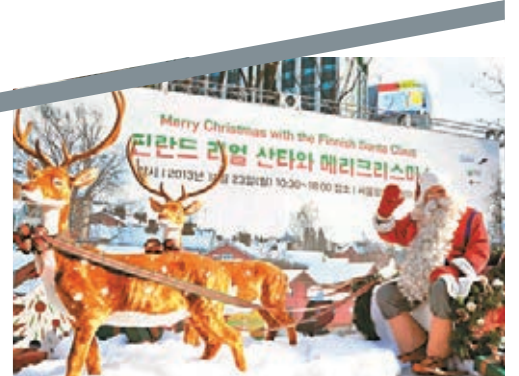
■芬蘭聖誕老人不穿黑靴。

每年聖誕節都有大批遊客湧到聖誕老人的家鄉芬蘭，親身探訪聖誕老人及感受濃厚節日氣氛。有當地企業擬向全球推銷聖誕老人，希望人們全年都會想起他，並以中國為首要目標。由於芬蘭聖誕老人的裝束和形象，與家傳戶曉的美國聖誕老人大有分別，推銷難度在於如何令消費者認同芬蘭的才是「正貨」。