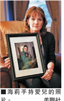
■海莉手持愛兒的照片。 美聯社

150袋圖米的骨灰在好心人幫忙下，現已灑至麻省海灘、牙買加森林及夏威夷的峭壁等地。有人更計劃帶骨灰登上珠穆朗瑪峰，另還有300人有意協助。海莉表示，打算將好心人寄給她的信與照片集結成冊，並把所得款項捐給新英格蘭器官銀行。 ■美聯社