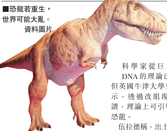
■恐龍若重生，世界可能大亂。 資料圖片

香港Nike接受本報查詢時表示，該波鞋原價為1,429元，上周六僅接受已預訂客取貨，不接受普通walk-in客購買。Nike表示，本月內都不會再返貨，至於明年何時再有仍屬未知數。