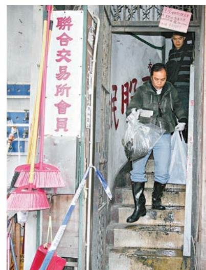
■警方自火場檢走證物包括可攜式爐具以調查是否冬至打邊爐有關。

入，半年前更曾有警員上門拉人，又試過有人踢門吵鬧。另一對亦住在樓上的溫氏夫婦，前晚起火期間正與家人做冬吃晚飯，溫太太說：「聞到出有煙味，老公走出去睇吓，見走廊好大煙走唔到。」他們慶幸沒有受傷，稍後由消防員利用升降台救下。由於家中暫被截電，他們決定回鄉暫住。