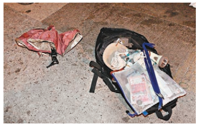
▲被捕「爆竊快閃黨」遺下的工具及贓款。 ◀警方在跑馬地加路連山道被爆竊日式拉麵店調查。

香港文匯報訊(記者 杜法祖)「爆竊4人組」配備汽車，企圖爆竊位於跑馬地加路連山道曾獲米芝蓮推介的日式拉麵店「拉麵Jo」，不料洩漏風聲，被俗稱「狗仔隊」的西九龍刑事情報科人員早接線報跟蹤監視，當場將其中3賊人緝獲並獲拘捕，而負責把風接應的「車手」則棄下同黨不顧開車逃走，負責調查的西九龍總區重案組B隊正追緝該名在逃「車手」歸案。而遇竊拉麵店2日來營業額3.7萬元得保不失。