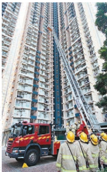
■消防升起雲梯監察反鎖屋內閩自殺男子情況。

香港文匯報訊(記者 杜法祖)有情緒病中年漢，昨凌晨在葵涌邨家中與妻因瑣事爭執，突情緒激動持雙刀危坐窗邊，其間更利刀架頸與警對峙，警方派出鐵甲龍龍警員到場戒備，談判專家亦奉召加入游說，擾攘近10小時後始衝入屋內將他制服送院，事件中無人受傷。