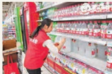
杭州各大超市近日瓶裝水銷量暴增。

儘管杭州市水務和環保部門均一致認為自來水煮沸後仍可以飲用,但許多市民出於「保險起見」的心態,還是選擇了其他飲用水。近日杭州各商場和超市瓶裝水銷量都出現明顯增長,原本冬天是瓶裝水的銷售淡季,近期卻迎來了銷量激增,甚至還使得杭城個別備貨不寬裕的超市出現短暫斷貨的現象。