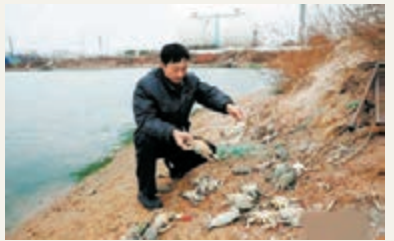
靠近原油洩露海邊的養殖池內的螃蟹大量死亡。

香港文匯報訊(記者 許桂麗 王宇軒 青島綜合報道)12月22日山東省青島市「11·22」東黃輸油管線爆炸事故已經過去了一個月的時間。據了解目前青島黃島區受爆炸事故影響的居民生活大部分已經恢復穩定,因爆炸事故受損的黃島二中的學生目前在黃島區內三所不同的學校上課,學校修復還在進行當中。另爆炸點附近的道路也在逐步修復當中,部分道路已經開始限行通車。據中新網報道,洩漏原油海灘污染開始顯現,居民養殖的蛤蜊、螃蟹和魚蝦受污染海水影響開始大量死亡,海灘石頭和沙灘上殘存的原油在短時間內難以自然淨化。