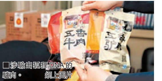
涉驗出狐狸DNA的驢肉。

該負責人建議,QS認證應該對企業,而不應該對產品,「有QS應該說企業具備生產合格產品能力,而不是說每個產品都合格。」該負責人也表示,其中利益鏈條複雜,企業只有一個,企業的產品卻有許多,每一類產品都要認證交費與企業只認證一次只交一次費相比,其中利益不言而喻。