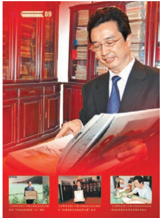
主編張迪杰精心審閱《毛澤東全集》