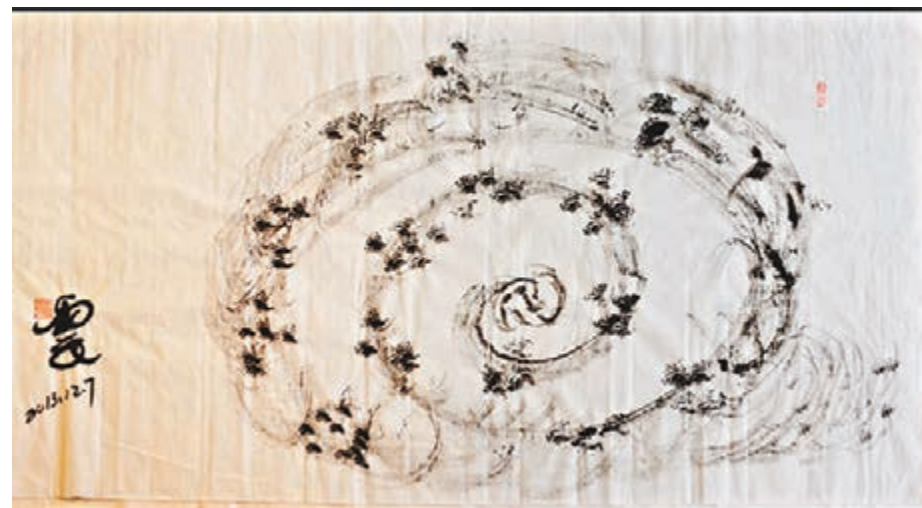
馬雲作品「馬體」拍得2,428,988元人民幣。