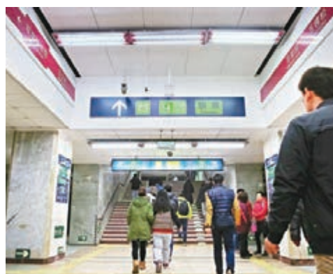
市民從地鐵1號線換乘地鐵9號線。