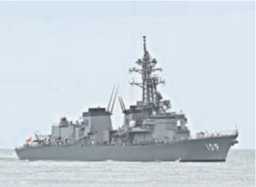
■日本「有明號」護衛艦。

香港文匯報訊 據日本新聞網報道，日本海上自衛隊與印度海軍從昨日開始，在印度南部的第二大城市金奈市的近海舉行聯合軍事演習。