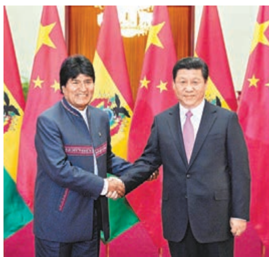
■習近平19日在北京人民大會堂同玻利維亞總統莫拉萊斯舉行會談。

香港文匯報訊 21日凌晨，西昌衛星發射中心，長征三號乙運載火箭噴射出熊熊烈焰，在驚天動地的呼嘯聲中拔地而起，將玻利維亞首顆通信衛星「圖帕克·卡塔里」送入太空。這是繼嫦娥三號任務圓滿成功後，西昌衛星發射中心2013年度航天發射的收官之作。中國國家主席習近平與已在中國訪問並觀摩發射的玻利維亞總統莫拉萊斯就玻星成功發射相互致賀。