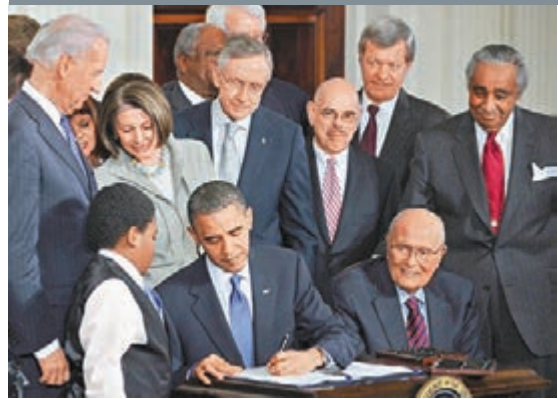
■鮑卡斯（後右二）2010年3月23日出席奧巴馬簽署醫改法案儀式。

香港文匯報訊 被美國總統奧巴馬提名為新任駐華大使的參議院財政委員會主席馬克斯·鮑卡斯20日在華盛頓表示，美中關係是世界上最重要的雙邊關係之一，如果提名獲得確認，他的目標是進一步加強美中外交與經濟關係。