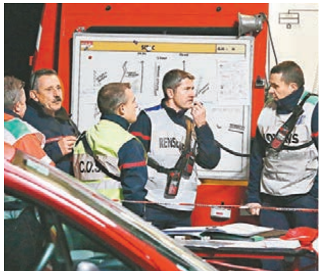
當地出動約100名人員進行搜救行動。