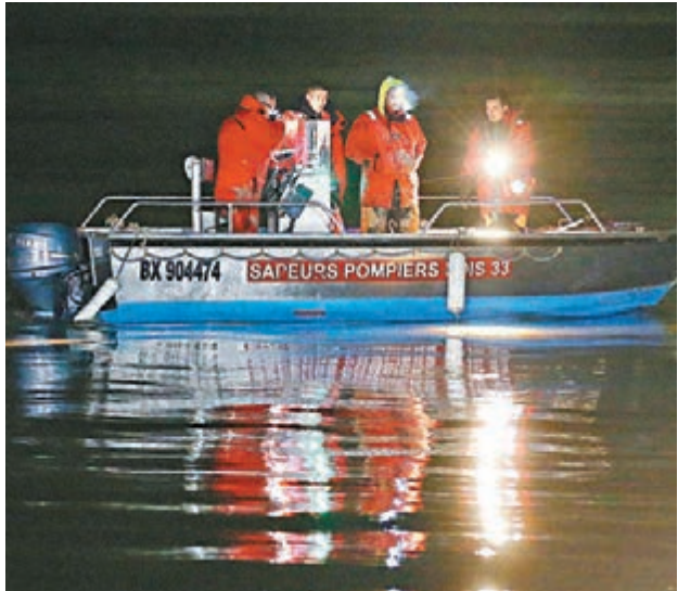
搜救員深夜在多爾多涅河繼續搜索3名失蹤者。