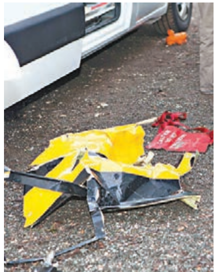
現場遺下直升機殘骸。