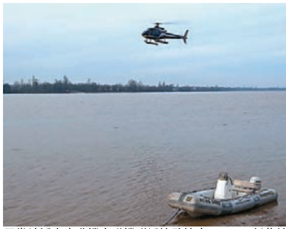
當地派出直升機在墜機附近協助搜索。