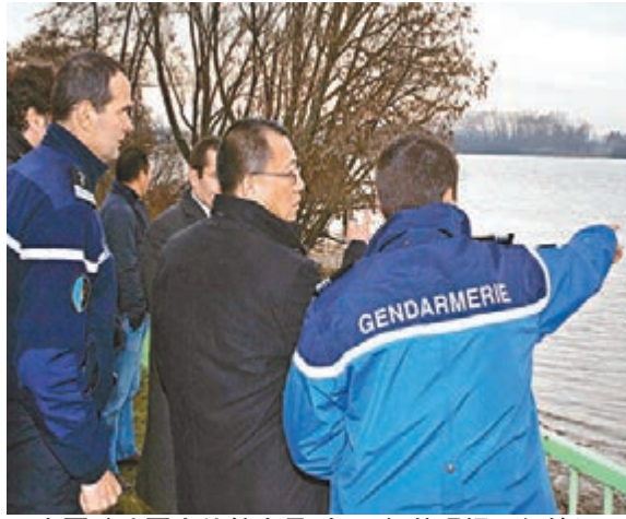
中國駐法國大使館人員(右二)趕赴現場了解情況。